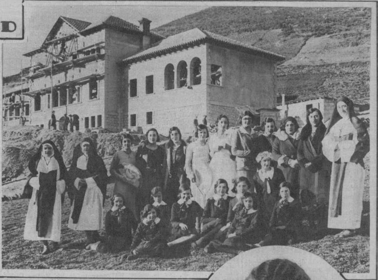
Camprodón.—Señoritas del «Club Femenino» local, que organizaron una función a beneficio del Hospital, cuyo edificio, en construcción, aparece al fondo de la fotografía.