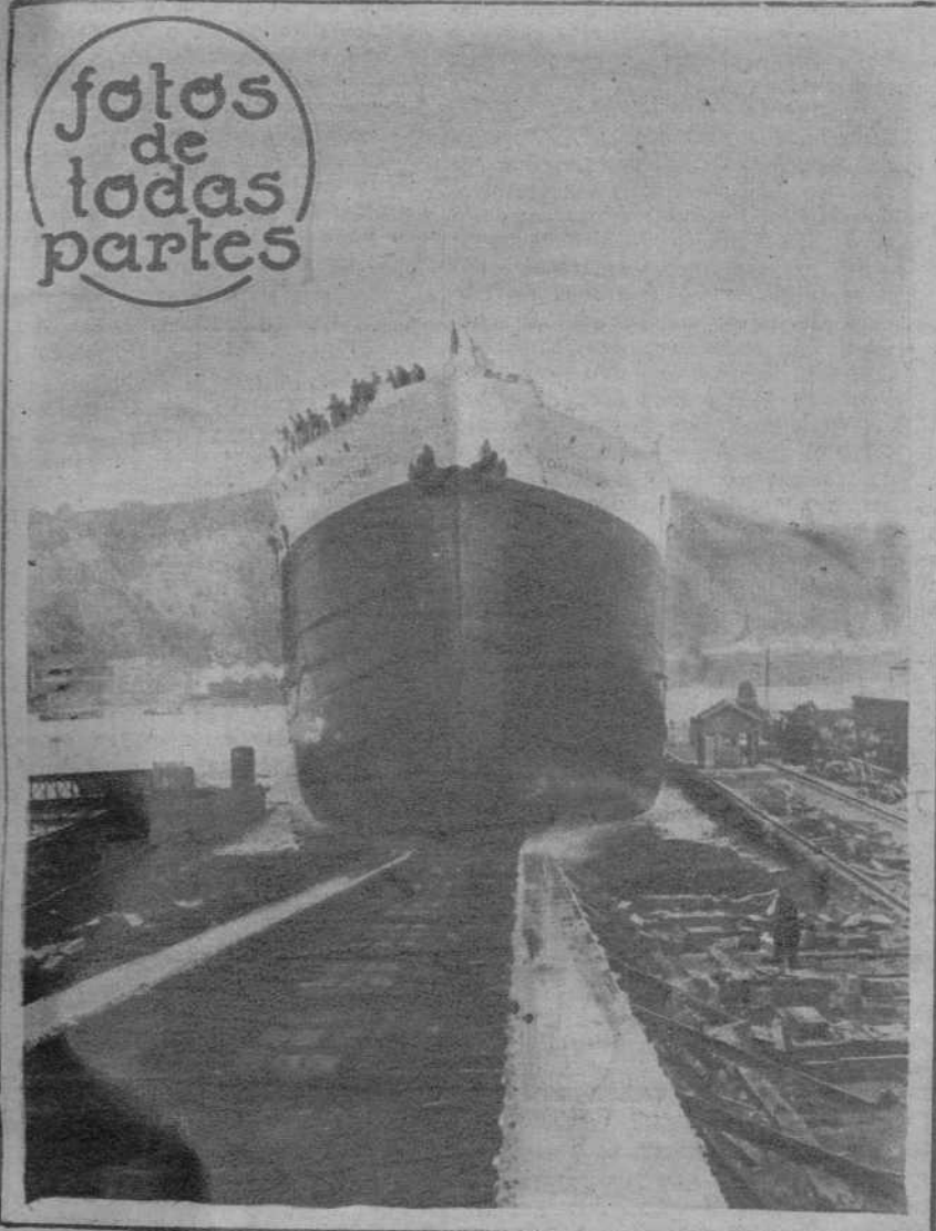
El nuevo buque, al entrar en el agua

SUSCRIPCIÓN CAPITAL Ptas. 225 al mes. SUSCRIPCIÓN PROVINCIAS Ptas. 870 trimestre NÚMERO SUELTO DIEZ CÉNTIMOS