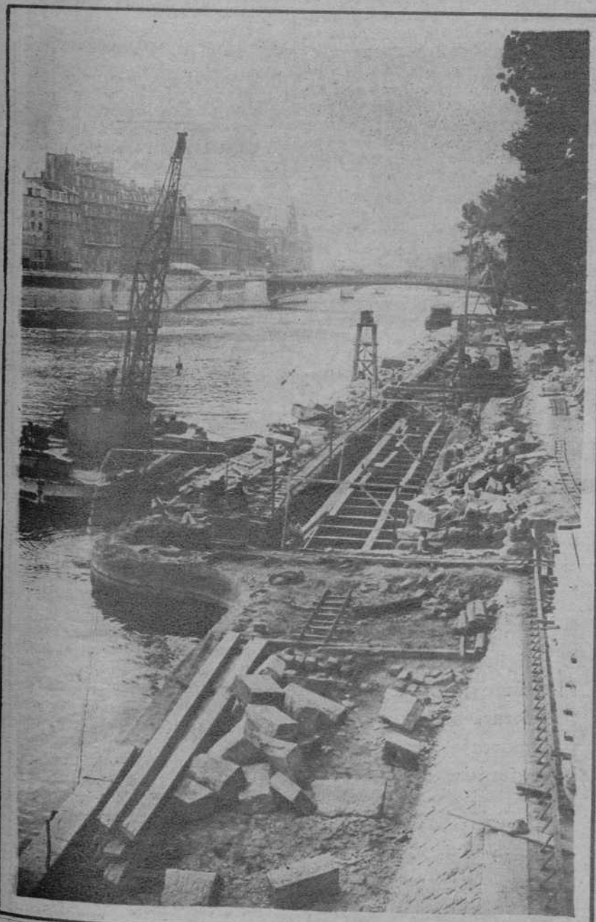
París.—Un aspecto de las obras que se realizan para el ensanchamiento del Sena.