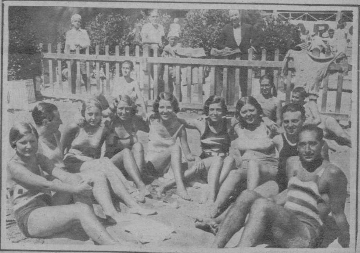
Un grupo de bañistas en la playa de Ercosis.