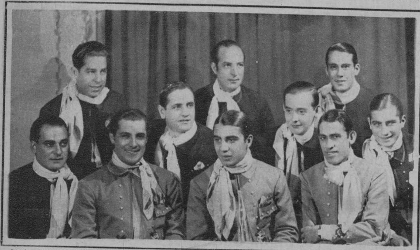
Irustra, Fugasot y Demare, los eminentes cantadores argentinos y su orquesta típica, que tomaran parte en el festival a beneficio del Sindicato de Periodistas, que se celebrara esta noche en el teatro Tivoli