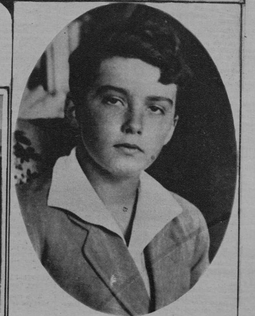
El príncipe Francisco José Otho, que ha cumplido 16 años y que se indica como probable candidato al trono de Hungría.