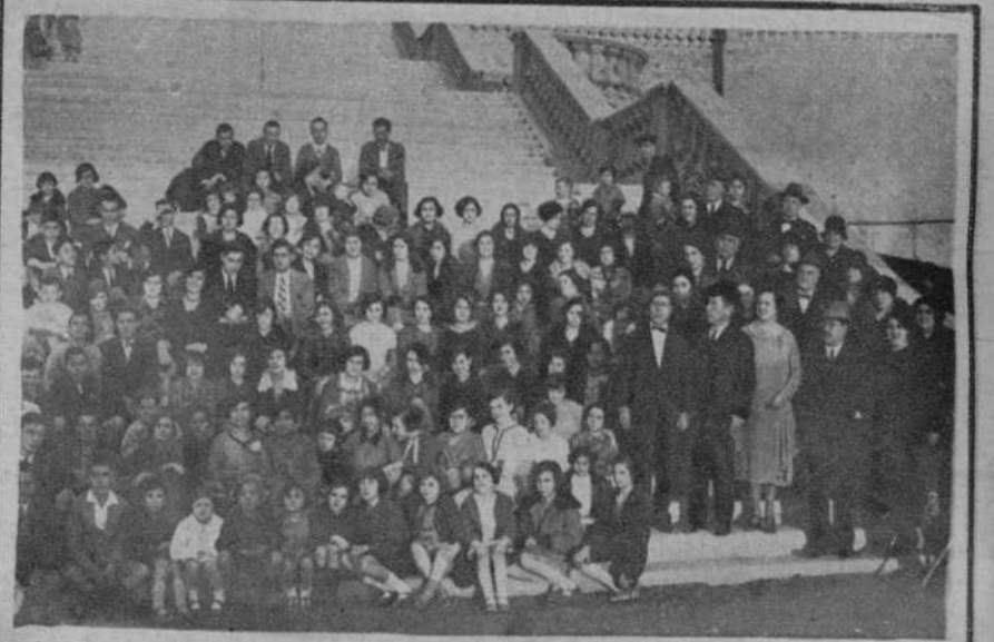
CARTAGENA.—Fiesta celebrada en el Parque Torres, por el Conservatorio de Música y Declamación.