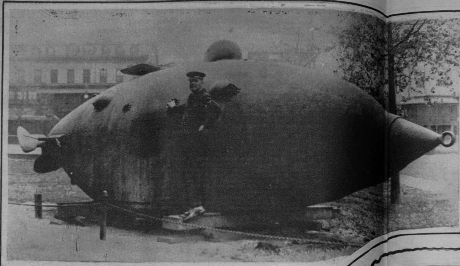
Submarino ideado en 1964, por Augusto Rice, que se conserva en Nueva York.