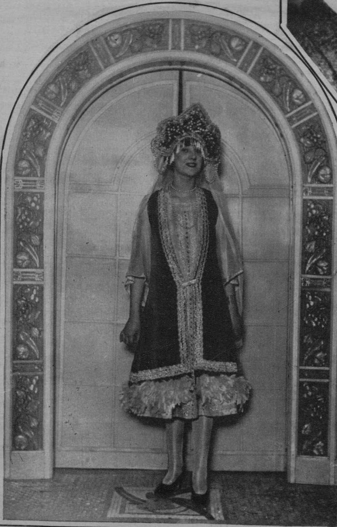
Modistilla que ganó el primer premio de trajes en el concurso de scatherinetless celebrado en París.