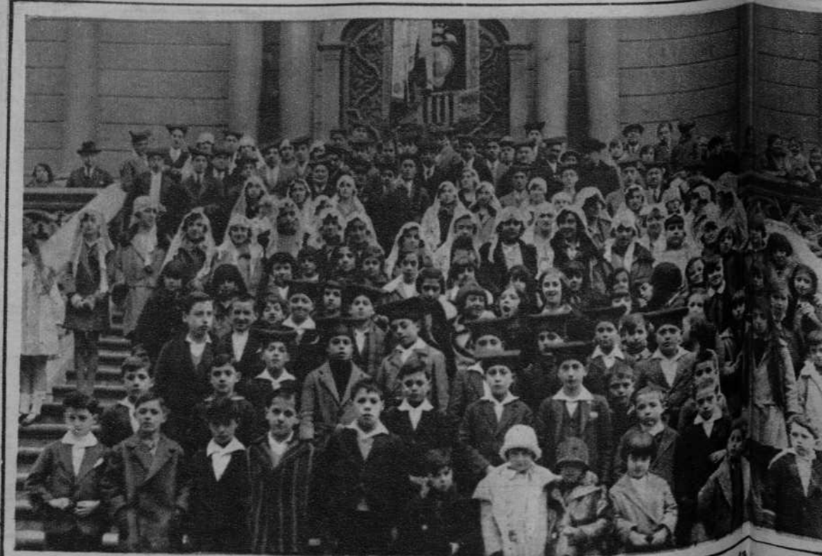
El «Orfeo Popular», de Otol, que ha dado un brillante concierto con motivo de la fiesta de Santa Lucia.