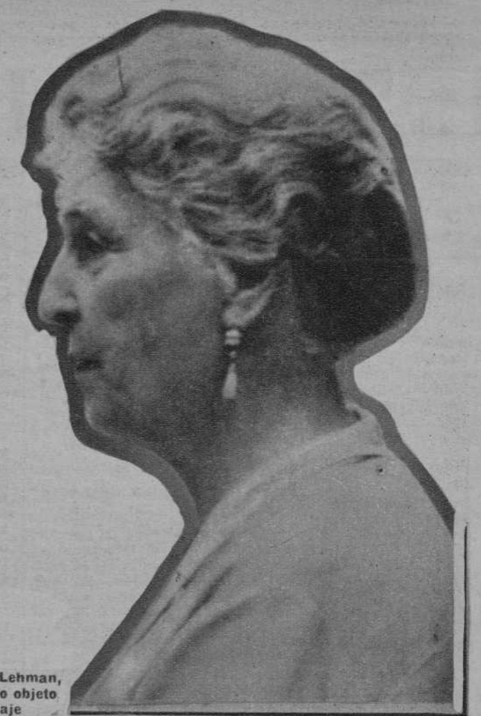
La eminente concertista Lilli Lehman, que al cumplir 80 años ha sido objeto «n Berlín, de un homenaje