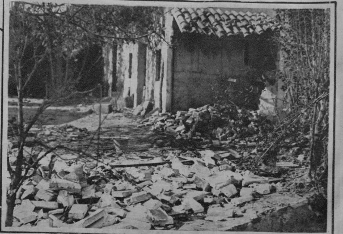
BENIMAMET.—Estado en que quedó el taller de pirotecnia, después de la explosión que ocasionó un muerto y cuatro heridos.