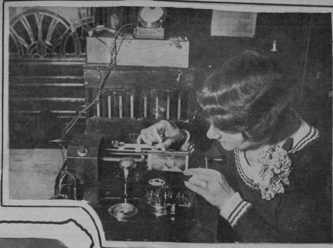
Se han efectuado pruebas, en Berlín, con gran éxito, de un modernísimo aparato transmisor de fotografías.