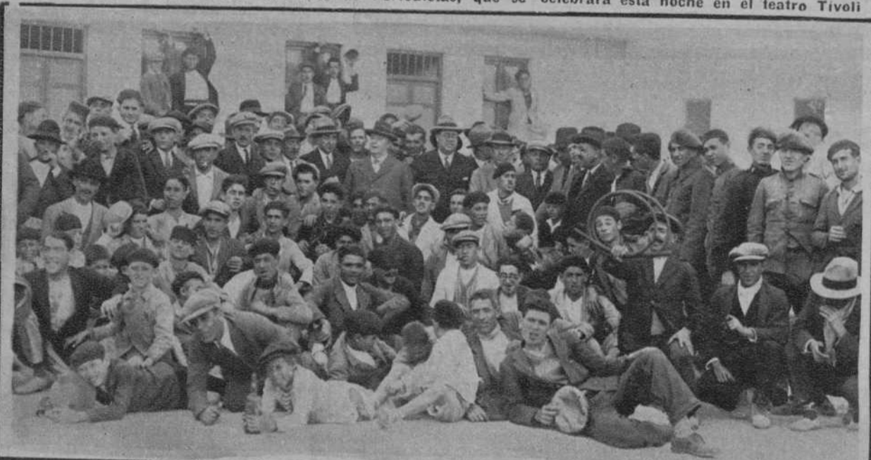
MELILLA.—El nuevo barrio para los damnificados de Cabrerizas Bajas. Fiesta obrera con motivo de la terminación de las obras del mismo.