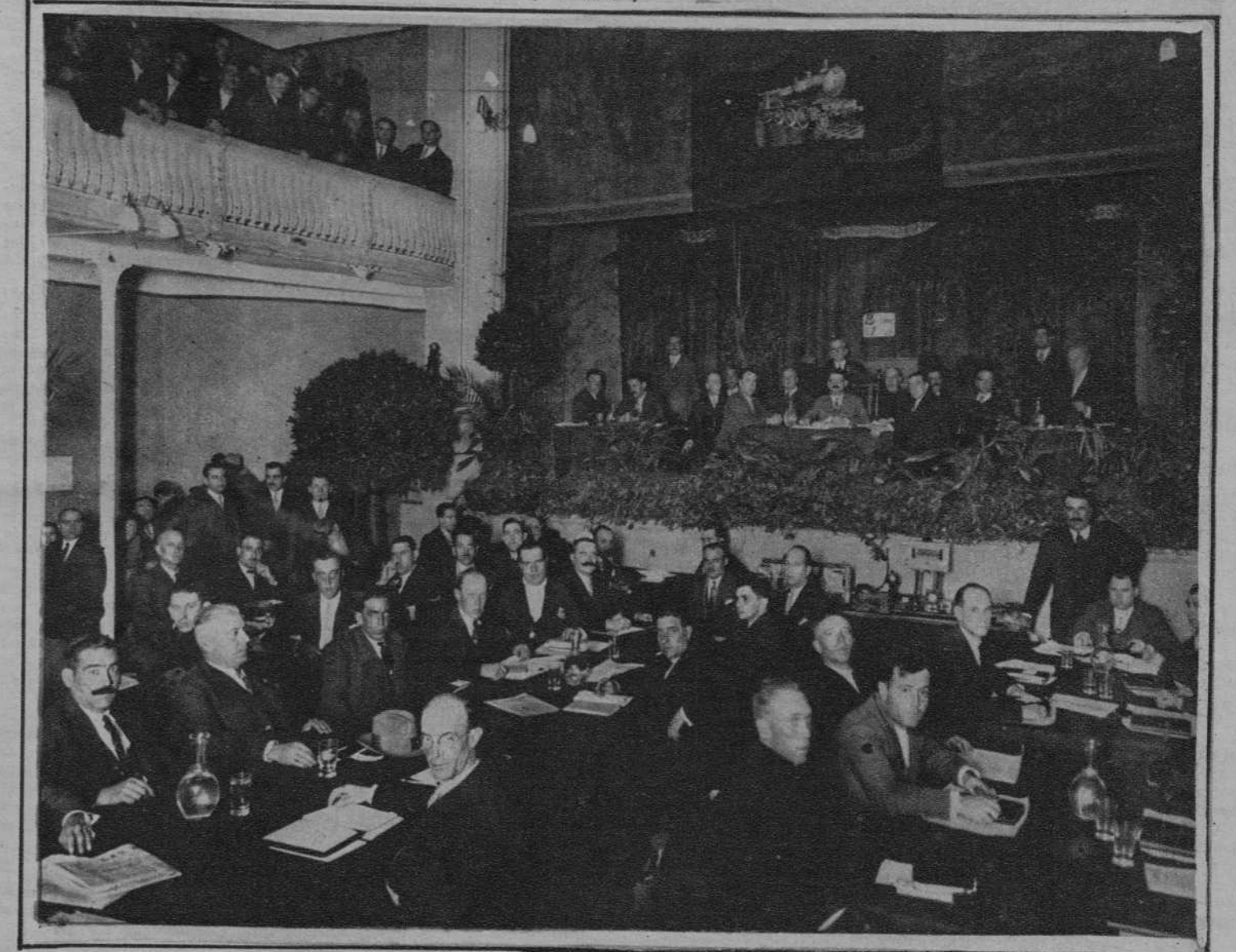
El Congreso Nacional de Ferrovias. La presidencia y los asistentes.