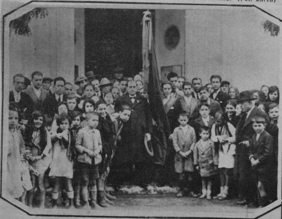
CORDOBA.—La masa coral del Figaró Cordobés, al salir de la iglesia donde le fueron impuestas, a la bandera, dos corbatas.