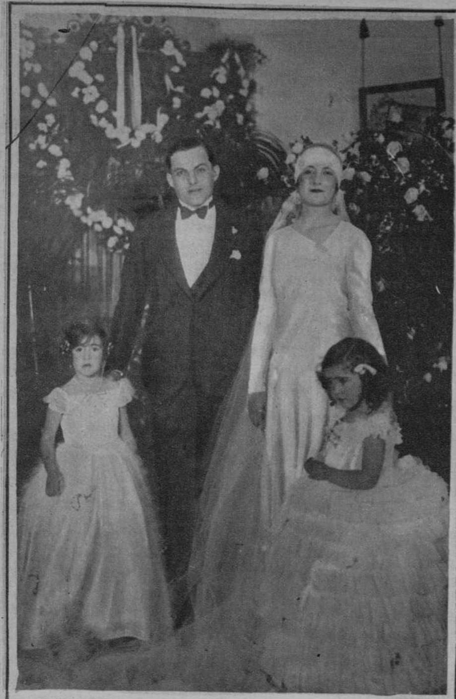
En Méjico ha constituido un acontecimiento mundano la boda de la hija del general Calles, con don Jorge Almada.