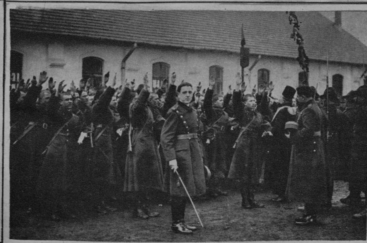
La jura de los nuevos reclutas en Bucarest.