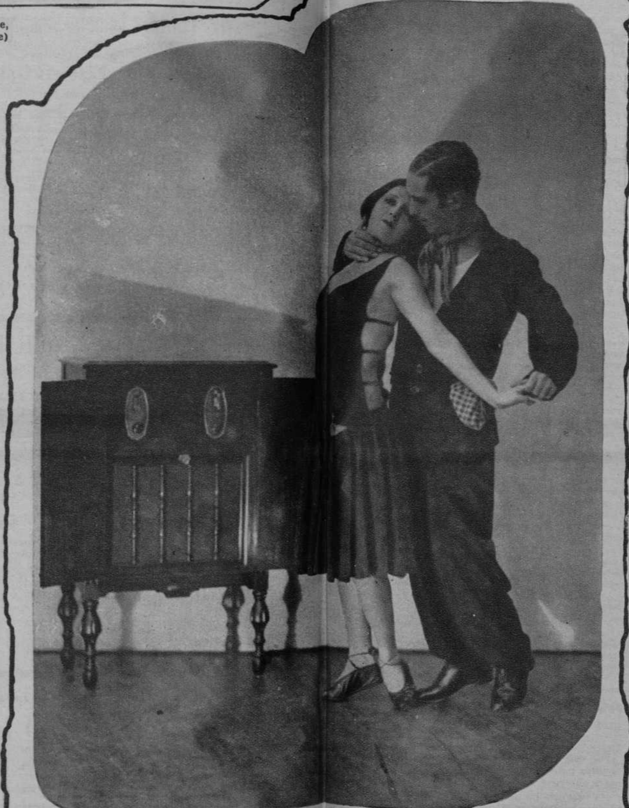
Los célebres bailarines Sacha Gouiney y Pereda, prefieren la musicalidad del Radio Corporation of America para sus ensayos - S.I.C.E. Fontanella, 8