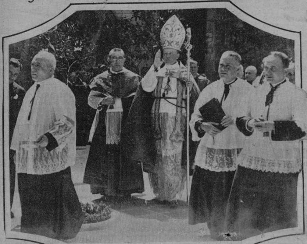
El Nuncio de S.S. dirigiéndose a bendecir el puente gótico de la calle del Obispo.