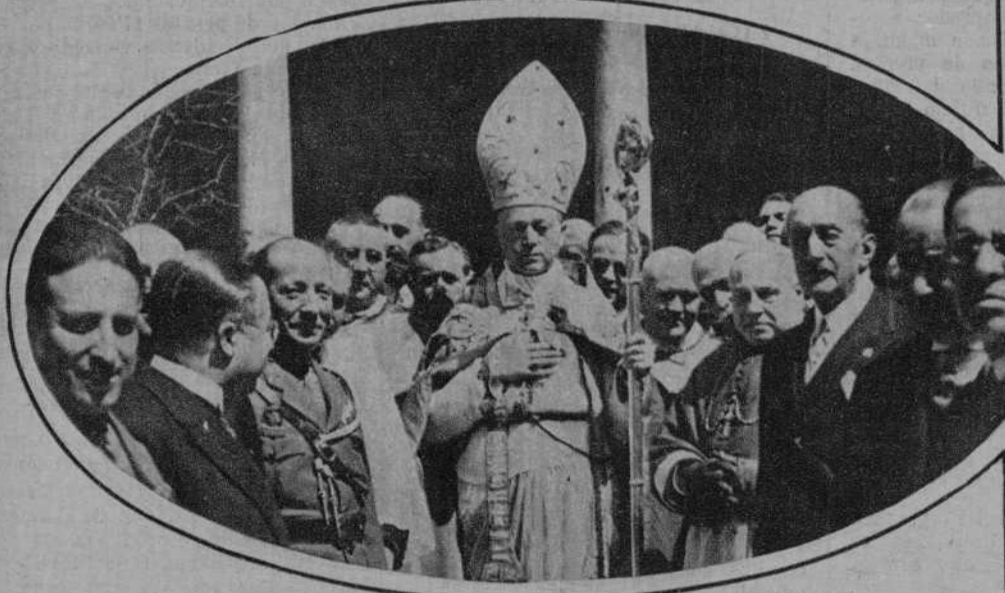
Monseñor Tedeschini acompañado de las autoridades