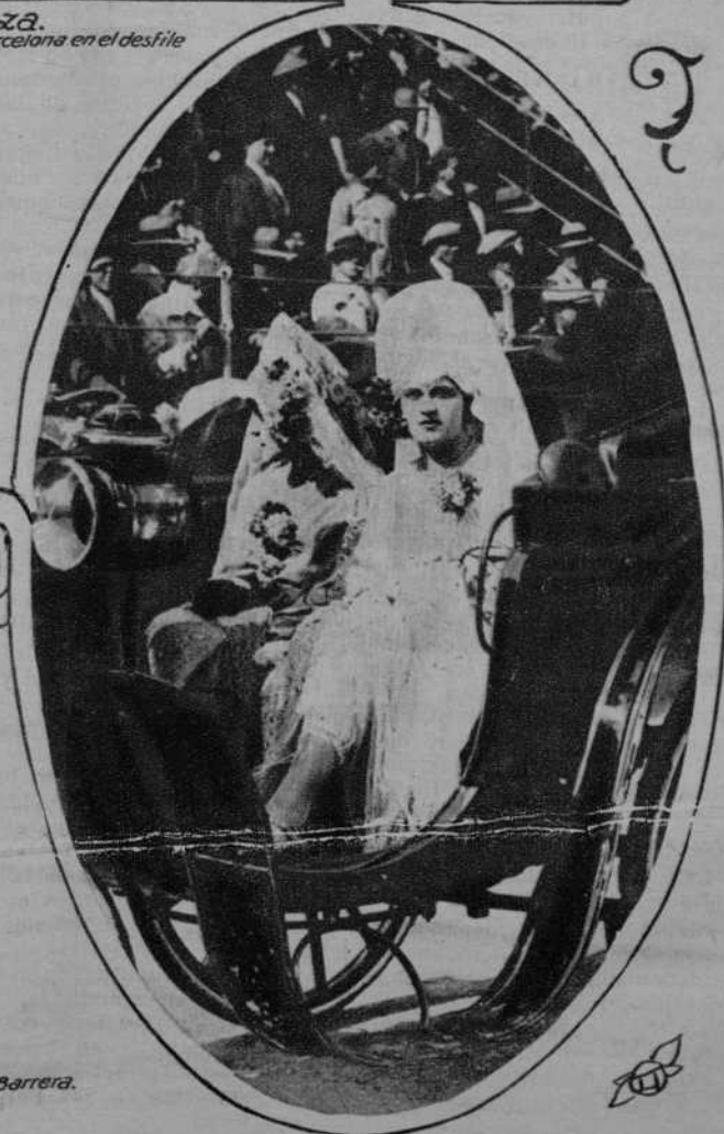
Las Presidentas de la segunda corrida Goyesca durante el desfile.