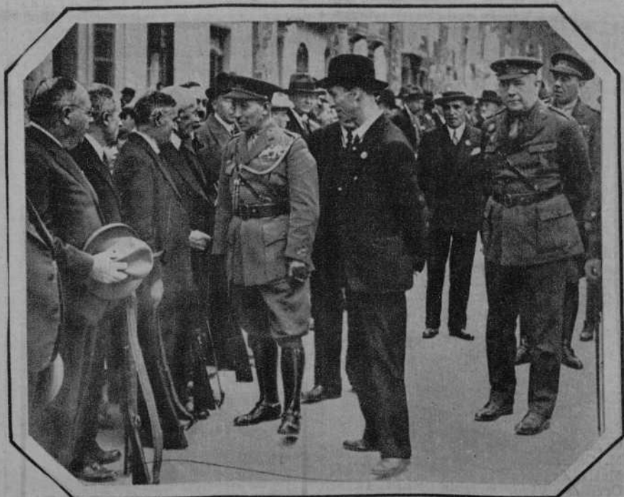
Revista de Somaten en Sabadell por el Capitan General Sr. Barrera.