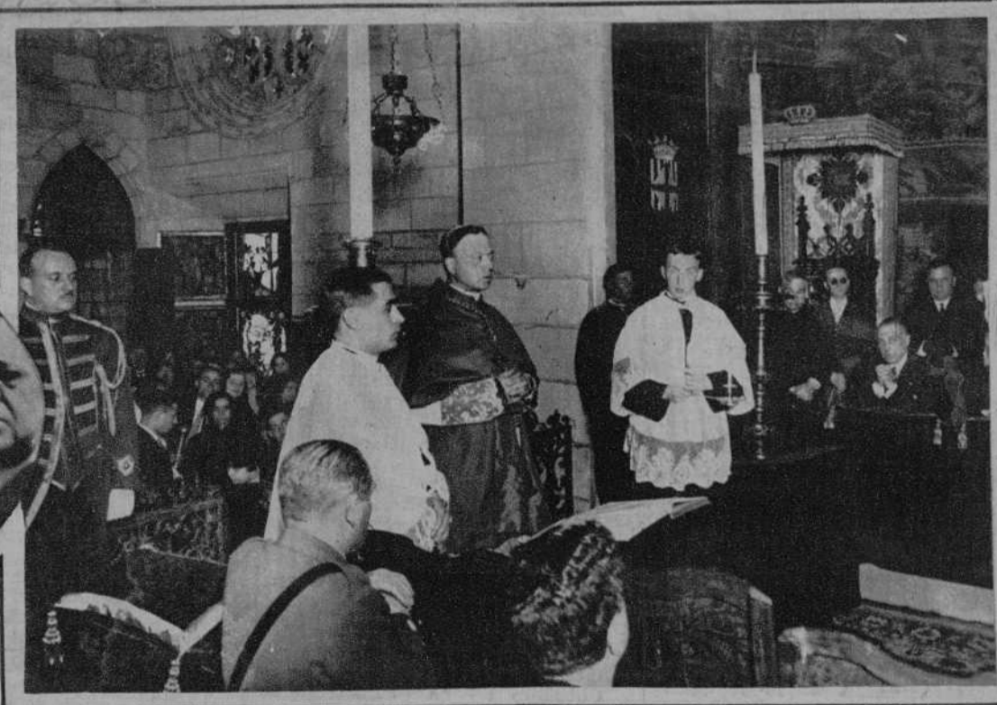
El solemne oficio en la capilla de San Jorge.