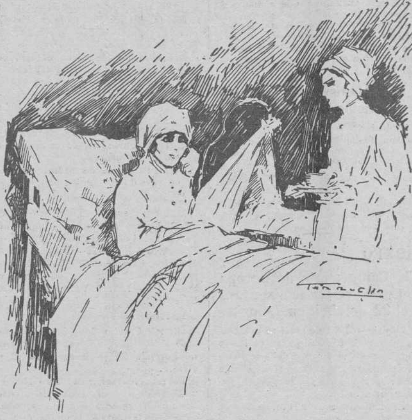
Una cama. Una madre. No sabemos qué tienen las camas de hospital o de estas Casas de Maternidad que nos parecen santas. No deben ser. Sobre todo éstas, en donde las madres ofrecen el fruto de un amor... prohibido, perdonado por el sacrificio...

Y cuando sus hijos se apean en la estación de la vida y se encaran con el mundo en el que han de sufrir y gozar; en el que han de ser vencidos o vence-