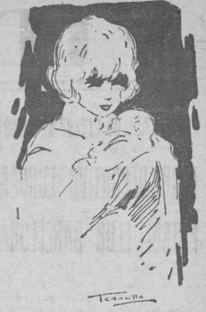
No hay nada que haya producido tanta literatura de bondad como la visión de un niño. Estos niños de la Maternidad que nacen en un ambiente de piedad y de bondad, nos mueven a ser buenos y compasivos. Acaso para que ellos lo sean con nosotros.

Las clientes de este departamento son, por regla general, señoras de la clase media, que no teniendo esa prevención ridícula de la mayoría de las mujeres españolas, a la Clínica, al Sanatorio y al Hospital, se precatan de que en un establecimiento como la Casa de Maternidad, bien montado y dotado de toda clase de aparatos quirúrgicos y