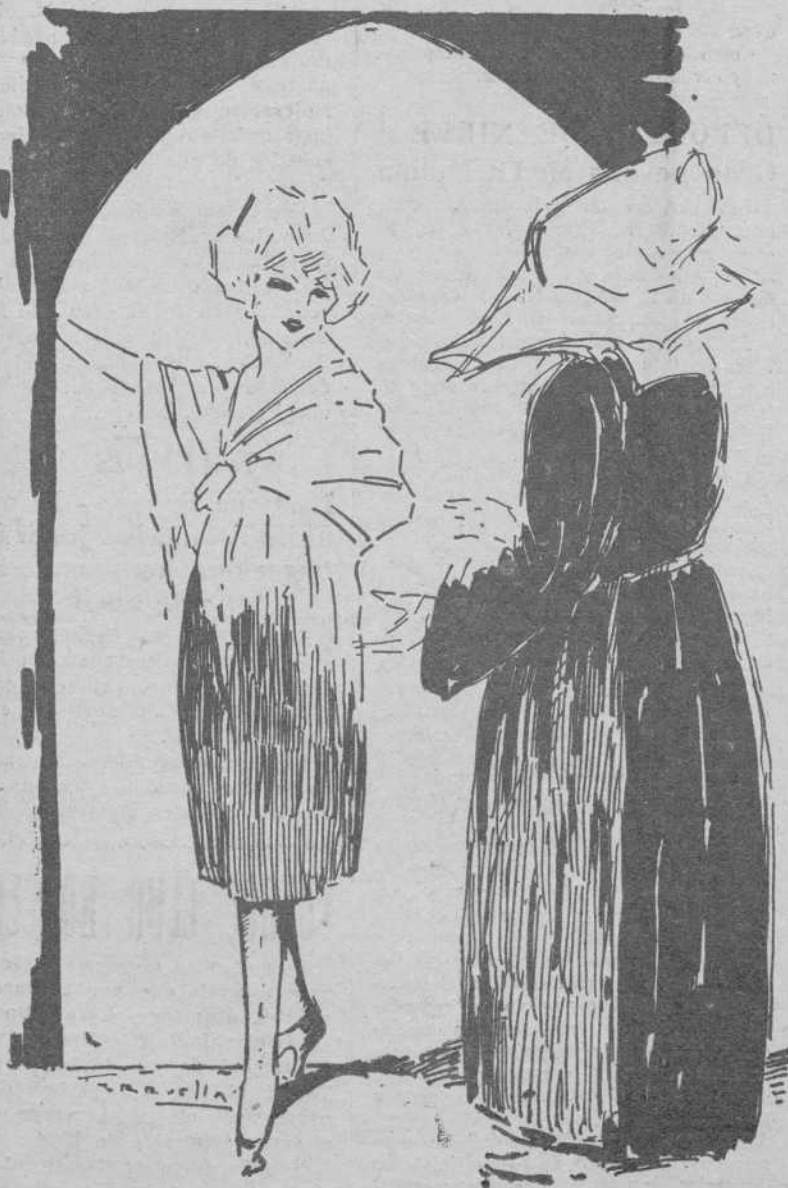
—Esta es la entrada. —Pase usted, hermana. —Es que... —No diga su nombre ni de dónde viene. En esta casa se recibe y se atiende sin necesidad de saber nada. Lo sabe Dios y basta... Pase usted, hermana...

Le hicieron entrega de una fotografía del acto que celebraron para festejar dicho nombramiento.