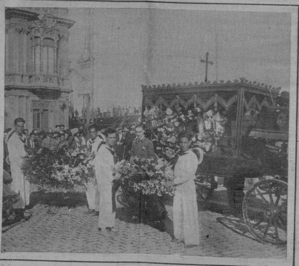
El entierro del capitán de corbeta don Adolfo Contreras.