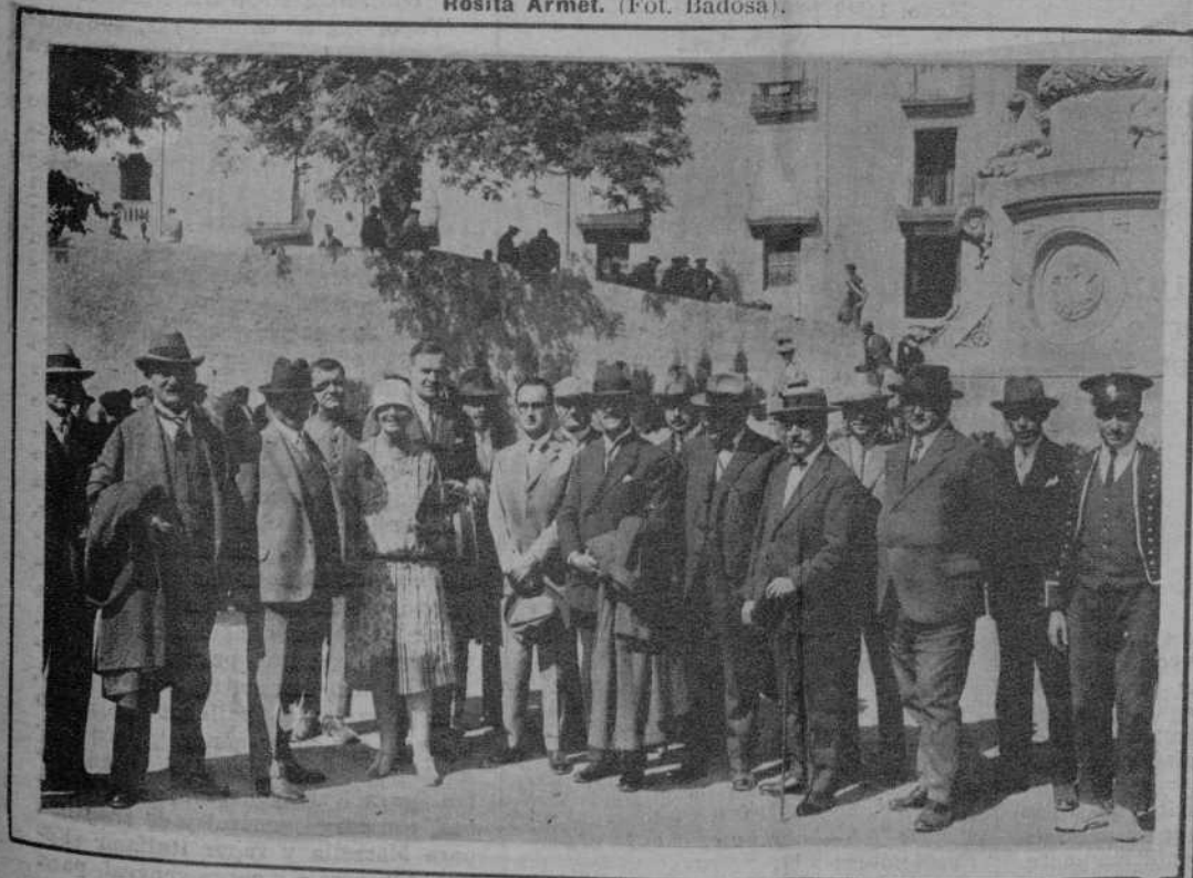
Grupo de vinicultores alemanes que fueron a Montserrat invitados por la Diputación.