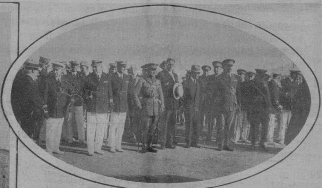
La presidencia del duelo.