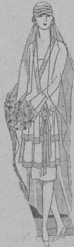
Modelo número I

El estilo antiguo, ya se ha desterrado y todos los trajes de novia, por estilizados que sean, tienen algo de modernismos que nos tranquiliza. Si a toda costa se quiere llevar algo en estilo antiguo puede usarse el velo, que podrá ser de blonda.