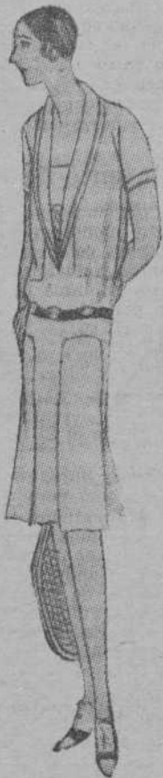
Modelo número 4

maverales, ésta es tanta, que, realmente, cuesta trabajo enumerarlos. Hemos visto un traje lindísimo y juvenil. De muselina estampada, la falda, que forma una enorme onda, está bordeada con puntilla, como las mangas y el cuello. El sombrero un poco ancho de «gors grain», lleva el mismo borde. Es una toilette un poco atrevida, puesto que sale de las líneas vistas hasta ahora; pero que indudablemente podría favorecer extremadamente a la mujer (modelo 3). Naturalmente, con la primavera llega el sport, un poco abandonado durante el invierno: el tenis. Para trajes de tenis se han visto en las colecciones toilettes que son una maravilla, y dentro de la línea antigua, se salen de todo lo visto. Por ejemplo, un traje de tenis de crespón color carne, abierto el escote para dejar ver un pechero en el que hay bordado un monograma. Dos pliegues forman la falda. La manga es corti-