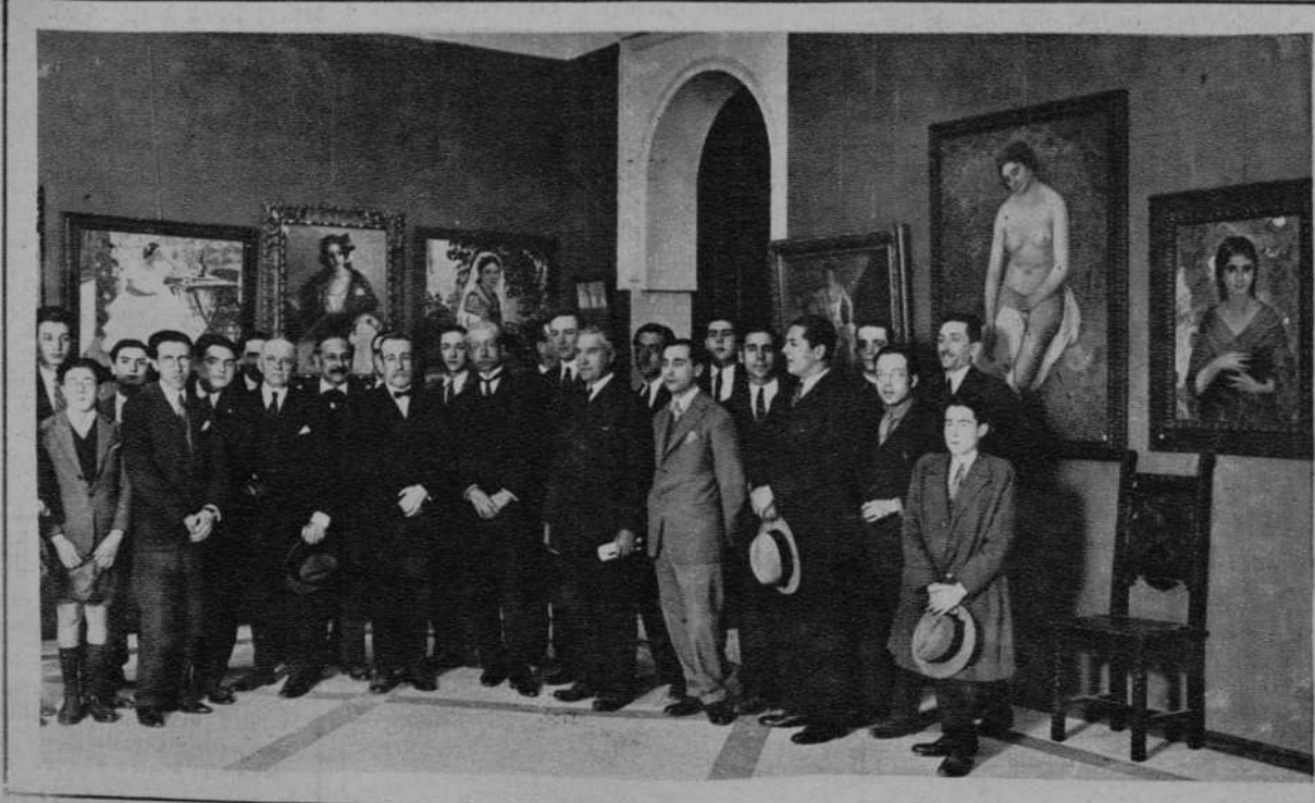
SEVILLA. Autoridades y expositores que asistieron a la inauguración de la Exposición de pintura. (F. C. Sánchez del Pando).