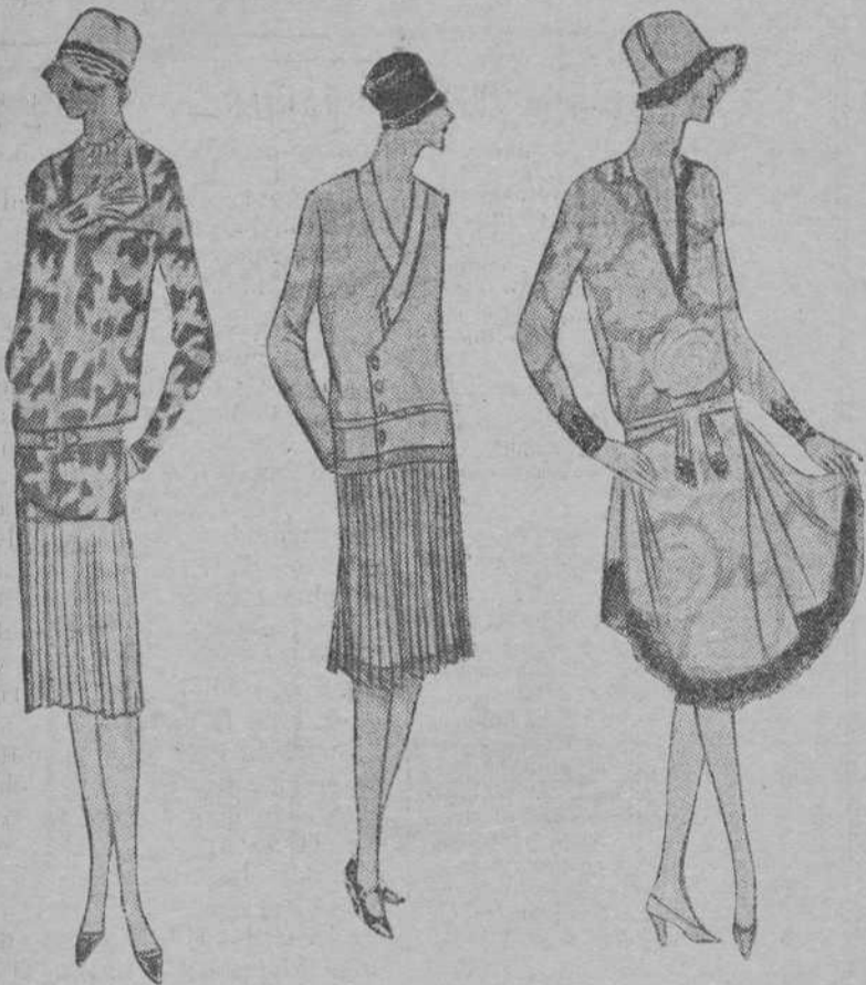
Modelo número 1