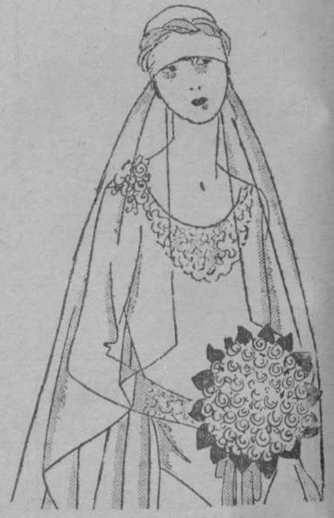
Modelo número II

rriente, hasta hace poco, en ramos, que se llevan en la mano, ha sido reemplazada por tupidos ramos de rosas blancas y rosa. Caprichos de la moda, que desea, hasta en esto, variación.