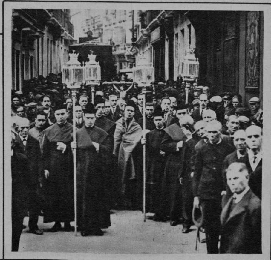
SEVILLA. La tradicional procesión de Doctrina, que anualmente celebra la Santa Iglesia Catedral.