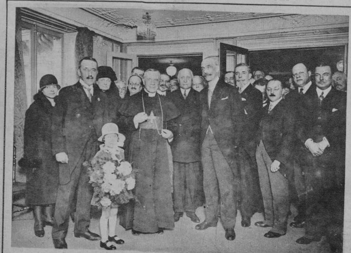
PARIS.—El cardenal Dubois inaugura el Círculo Internacional Católico, en presencia de los representantes de diversos países.