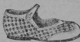
«MILADY» piel Kinkla lavable, color camello con tiras Naco blanco

Los pequeños serán obsequiados con lindos juguetes instructivos