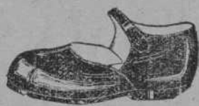
«SATURNO» dónbola beige con adornos Naco color bol de rose

Le ofrece para el próximo domingo de Ramos, su hermosa colección de verano. Visite a su distribuidor, y verá seguramente algo que ha de interesarle LOS ZAPATOS QUE HARAN SONREIR A SU NENE