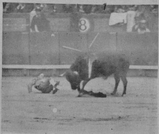
MADRID.—Cogida de Vaquerito en el primer toro.