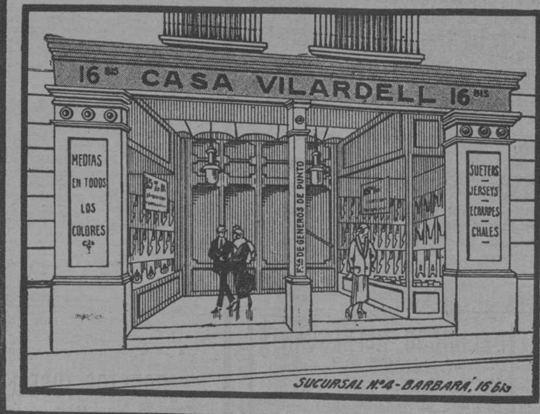
SUCURSAL N.º 4 - BARBARA, 16 bis