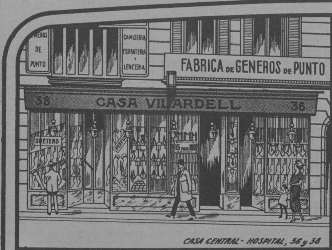
CASA CENTRAL - HOSPITAL, 56 y 38

Teléfonos: 3658 A, 3659 A, 1229 A, 4681 A, 1044 S. P. --- Apartado Correos 839. --- Dirección telegráfica y telefónica: "MEDIAS"