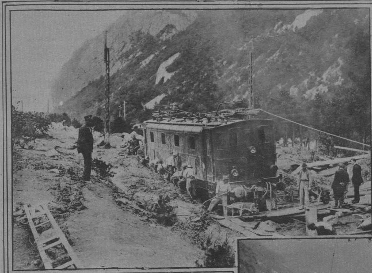
Suiza.- Destrozos causados en la línea férrea del tren eléctrico de Lausane, por el desbordamiento del río Rodano.