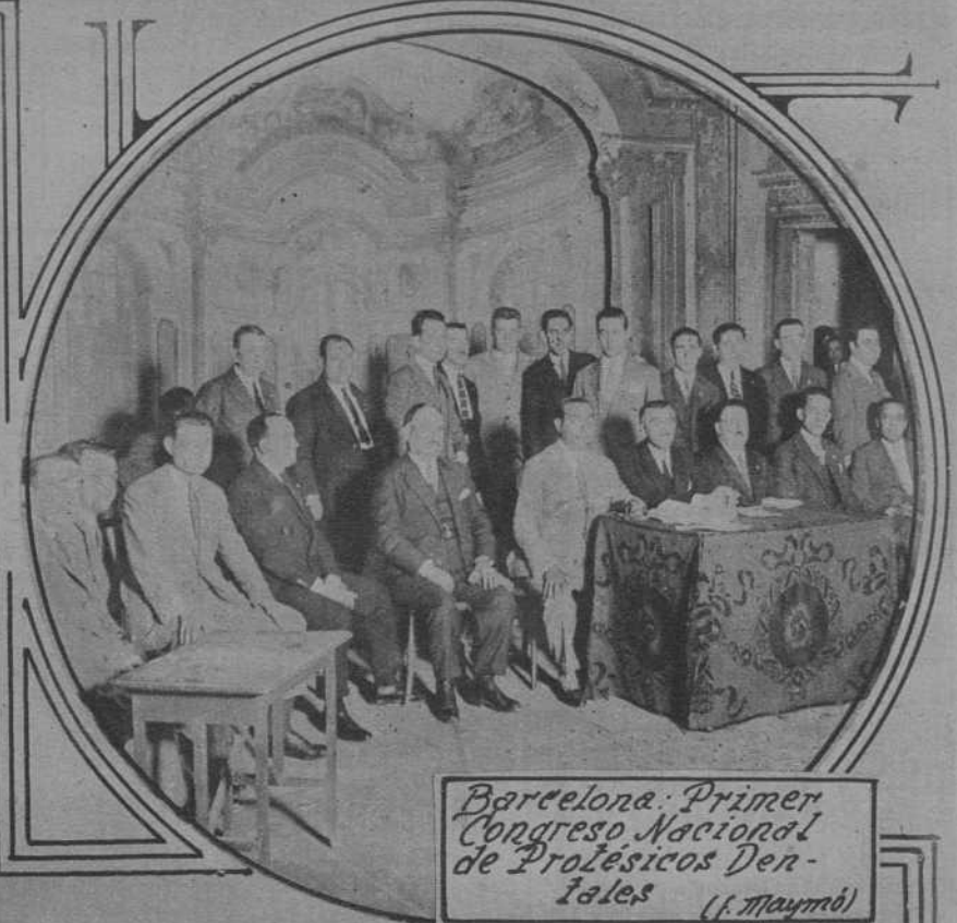
Barcelona: Primer Congreso Nacional de Prótesis Dentales