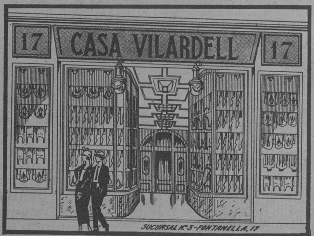
SUCURSAL N.º 3 - FONTANELLA, 17