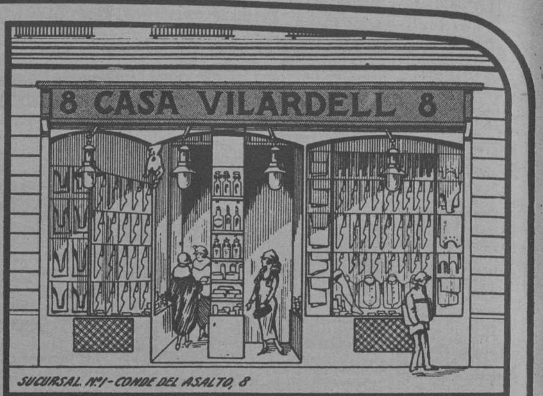
SUCURSAL N.º 1 - CONDE DEL ASALTO, 8

Los seis establecimientos más importantes