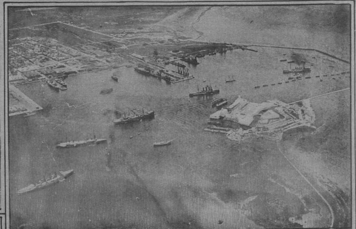
Una vista de Veracruz, que ha sido azotada por un horrible ciclón.