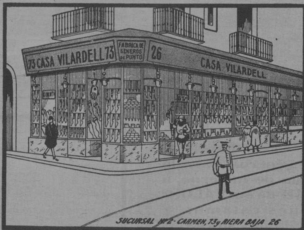
SUCURSAL N.º 2 - CARMEN, 73 y RIERA BAJA 26

Los seis establecimientos más importantes