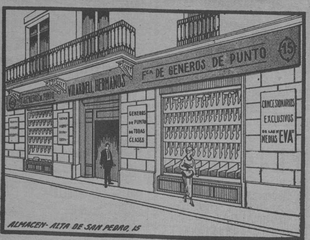
ALMACEN - ALTA DE SAN PEDRO, 15

Comprando en estos Establecimientos obtiene Vd. la máxima garantía de calidad y precio