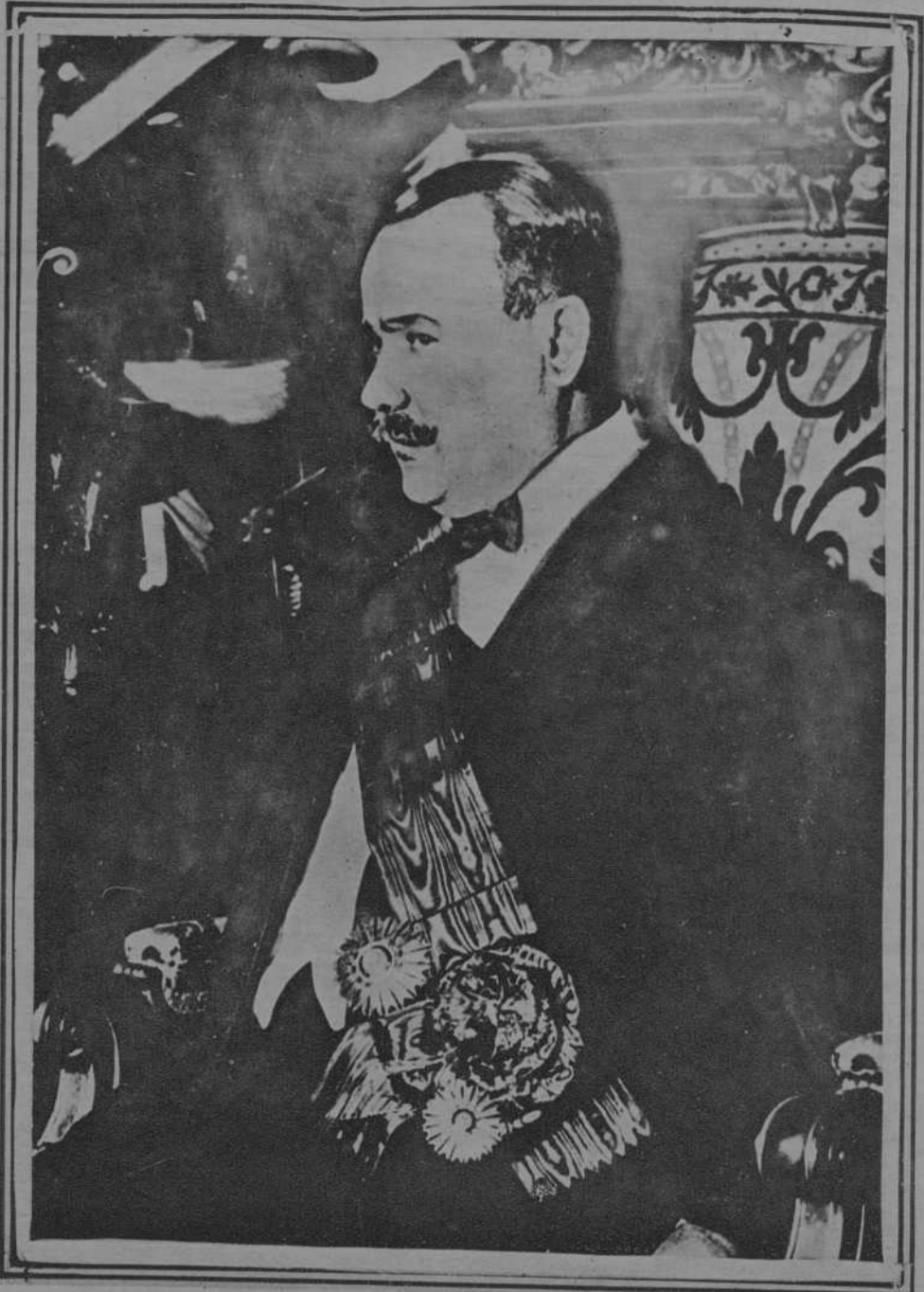
El ex-presidente de México, general Obregón, que se dice ha sido asesinado por los indios yakis