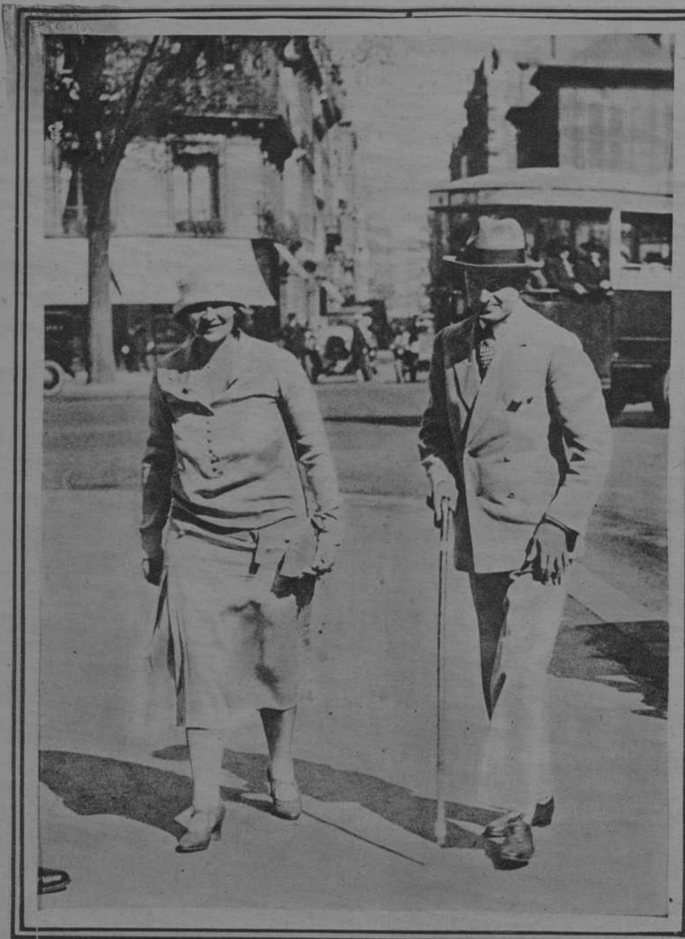
París.- Después de un paseo matinal, la Reina de Jugoslavia, regresa a su hotel acompañada del secretario del Rey.