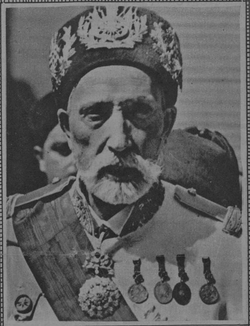
El Bey de Tuner, que ha llegado a Francia.