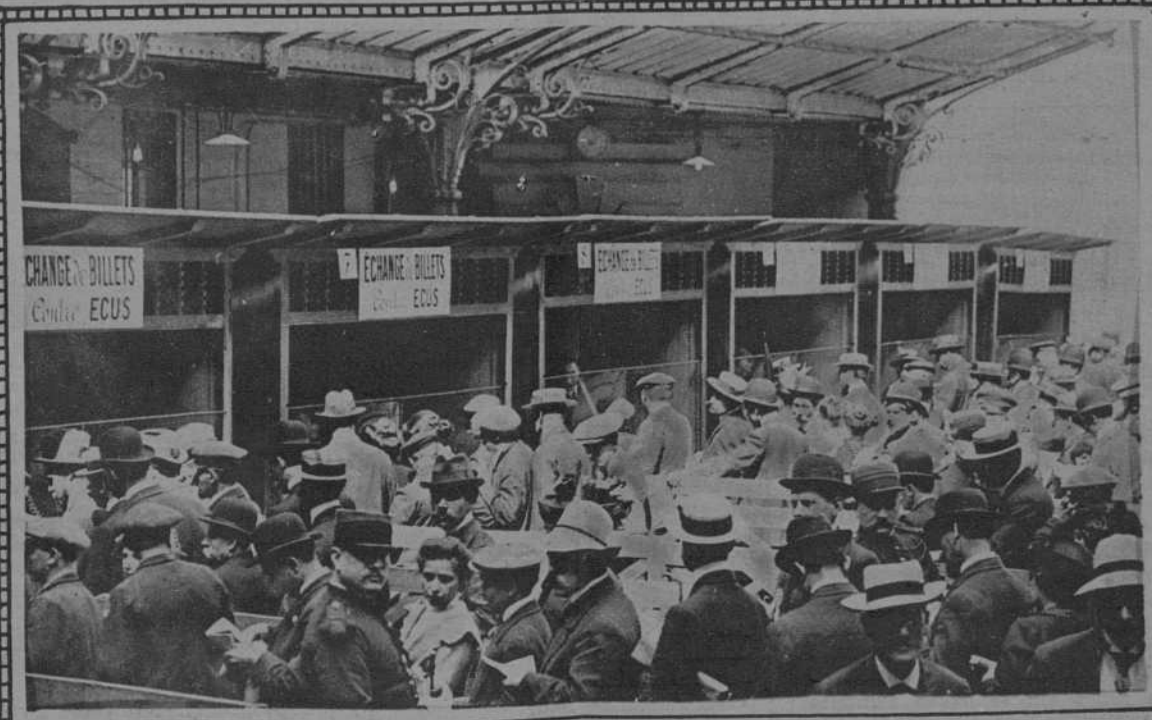
Francia. - Hace doce años. - El público, cuando la guerra, queriendo al llamamiento del Gobierno, para cambiar la moneda, en papel del Banco de Francia.