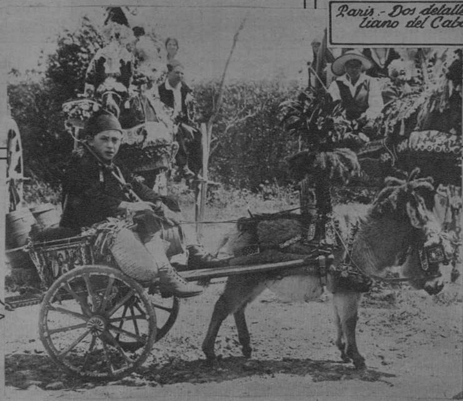
Paris - Dos detalles del Concurso siciliano del Caballero Florio (J. Consorcio)