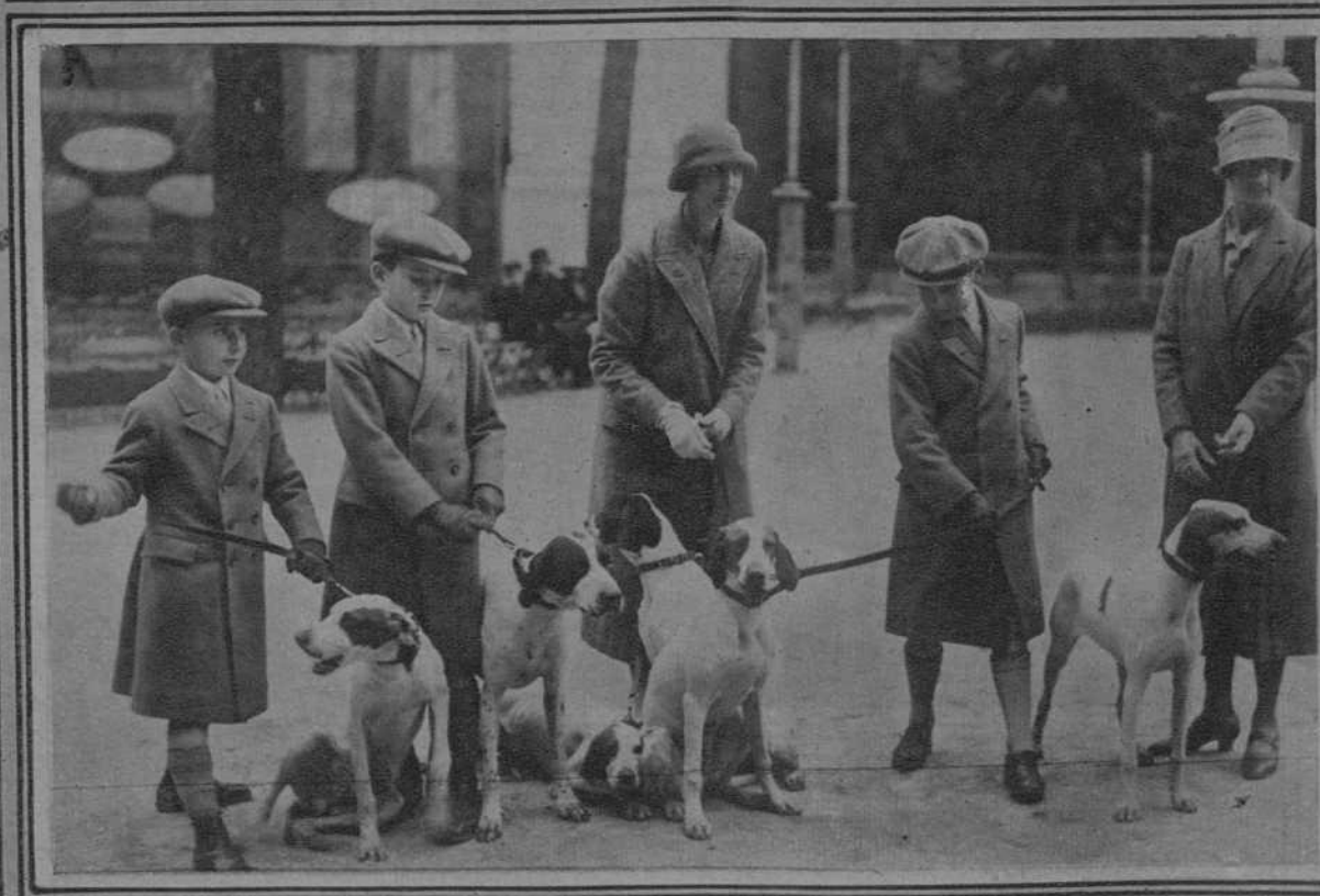
1. Valencia. La fiesta de las Cruces. Cruz colocada en la fachada de la capilla de la Virgen. (f. Masip). - 2. Alcalá de Henares. Un aspecto de la interesante Exposición de Arte Religioso. (f. Vidal). 3. París. La feria de las obras producidas por los artistas del barrio de Montmarbre. (f. Meunier). Madrid. De la "Exposición Canina". 4. Una expositora con su "Pomerania". - 5. Varios expositores de un hermoso grupo de "pomeranos ingleses" (f. Vidal).