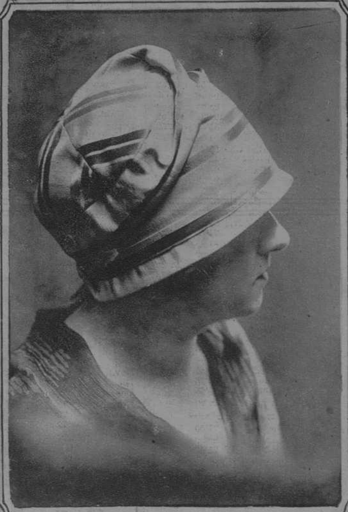
Elegante modelo de sombrero confeccionado en la acreditada casa Maison Germaine Puertaferrija 6.