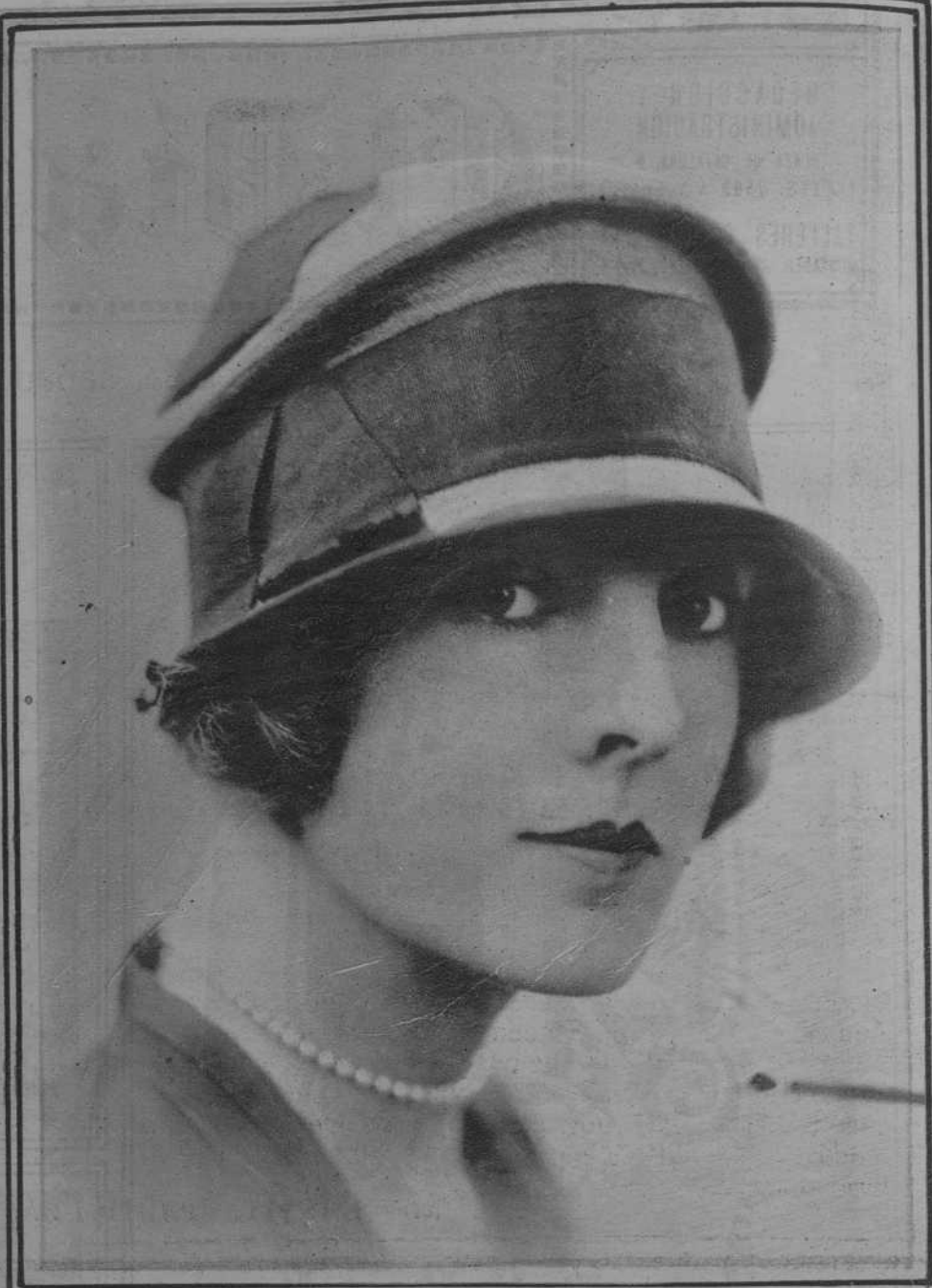
La moda parisina. - Dos elegantes modelos de sombrero.