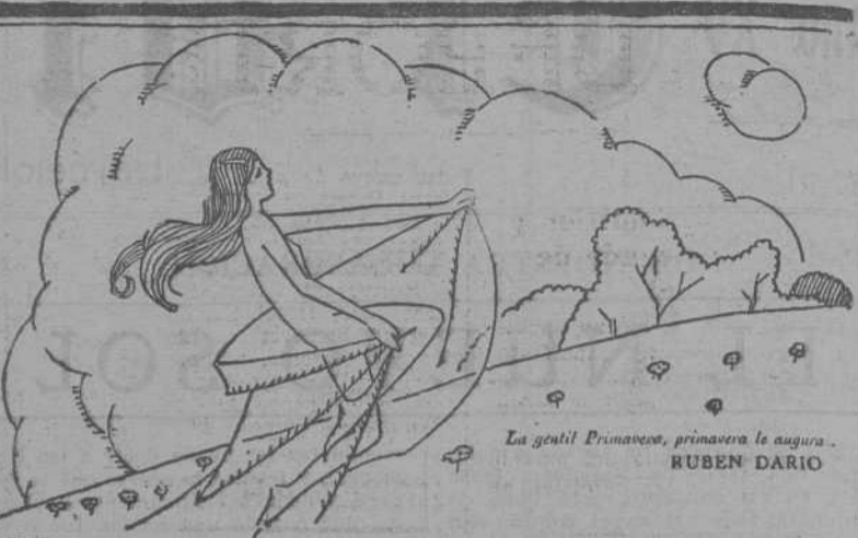
La gentil Primavera, primavera la augura. RUBEN DARIO