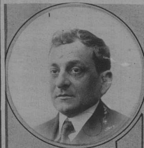
El pintor catalán J. Vallés Glusas, que actualmente celebra una notable exposi- ción de acuarelas en las Salones Cayetanas