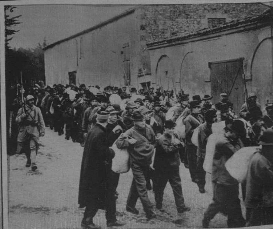
Copenhague. - Entierro de la Reina Luisa de Dinamarca. - 1. El cañón con el féretro. - 2. La fúnebre comitiva al ponerse en marcha. - 3. La presidencia del duelo, en la que figura el Rey de Dinamarca. - 4. La Guardia Imperial ante el Palacio. - 5. Francia. Traslado de 340 presidarios a la Suayana. (J. Vidal-Muñoz)