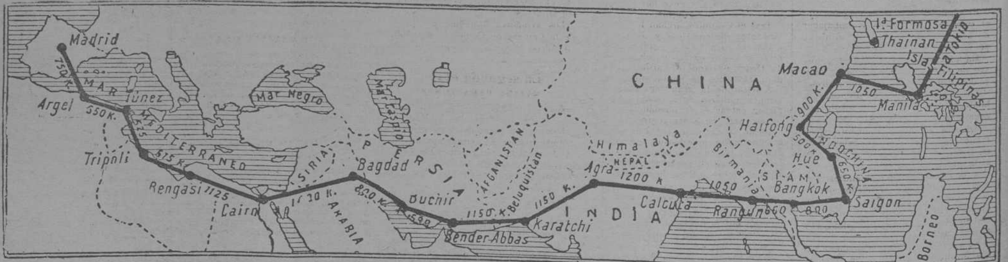
Gráfico del vuelo Madrid-Manila

En este momento el presidente de la Junta de Obras del Puerto lee el