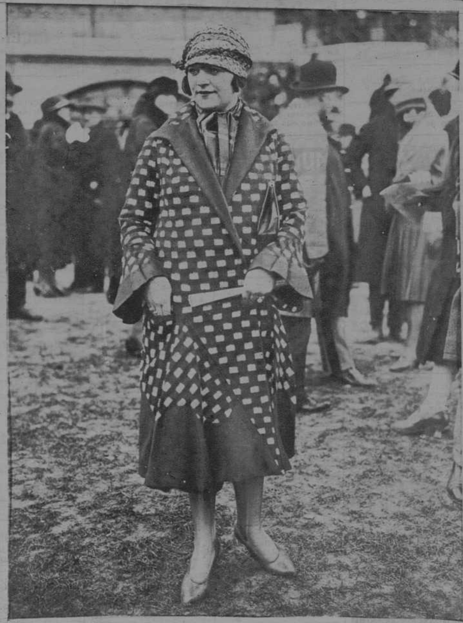
Las últimas creaciones de la moda exhibidas por los modistos parisienses