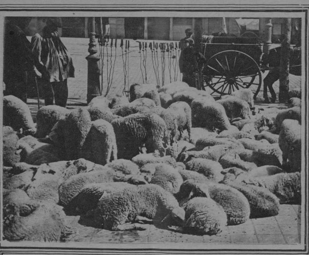
Barcelona: Una de las típicas paradas, para la venta de corderos, en la feria de Pascua Madrid: Monumento a Simón Bolívar, que uno de estos días será embalado para enviarlo a Panamá, donde va a ser erigido, obra del notable escultor valenciano D. Mariano Benlliure.