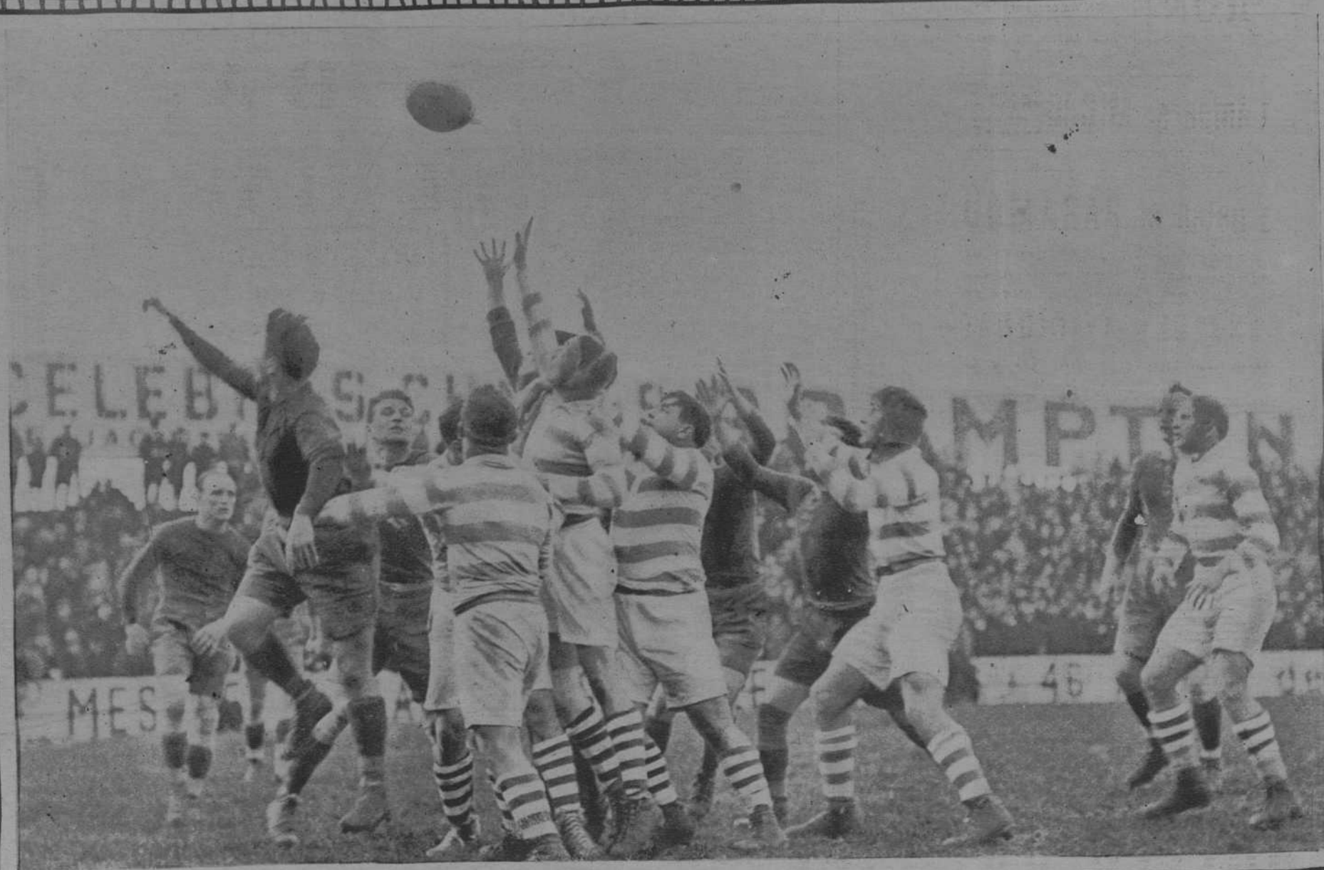
Paris: En el velodromo de Buffalo: Un momento del campeonato ciclista, recientemente celebrado.- Una fase del match de "Rugby" entre "T.O.E.C."- "Stade Français" (J. H. Monnet)