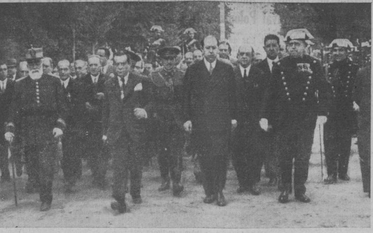
El ministro de la Guerra, señor Gil Robles, a su llegada a Ciudad Real para hacer entrega a la Guardia Civil de la bandera regalada por suscripción popular