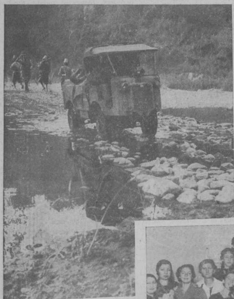
Trozo de una de las carreteras construidas por los italianos en Abisinia, para poder enviar a las tropas material y víveres