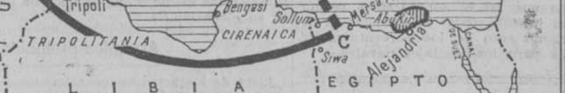
LA SITUACION MILITAR EN EL MEDITERRANEO CENTRAL Y ORIENTAL.—Mientras que Malta ha sido abandonado por la flota inglesa, que se ha trasladado a Alejandría, en esta base se apresuran los trabajos de fortificación. En Marsa Matrui se ha instalado un gran aeródromo inglés y el de Abukir ha sido agrandado. En Sollum y Siva se concentran tropas y material. El resto de la flota inglesa se halla fondeada en las radas occidentales de Grecia. La italiana está en el Dodecaneso

el Mediterráneo central. Alejandría, en cambio, dista seis horas de vuelo de las costas metropolitanas de Italia. La situación estratégica del Mediterráneo central es, por demás, singular en estos momentos. En el gráfico se señala un triángulo, de lados curvilíneos, que llamamos A, B y C, cuyo dominio da el del mar azul. La geografía política, sin embargo, no ha dado a ningún país la