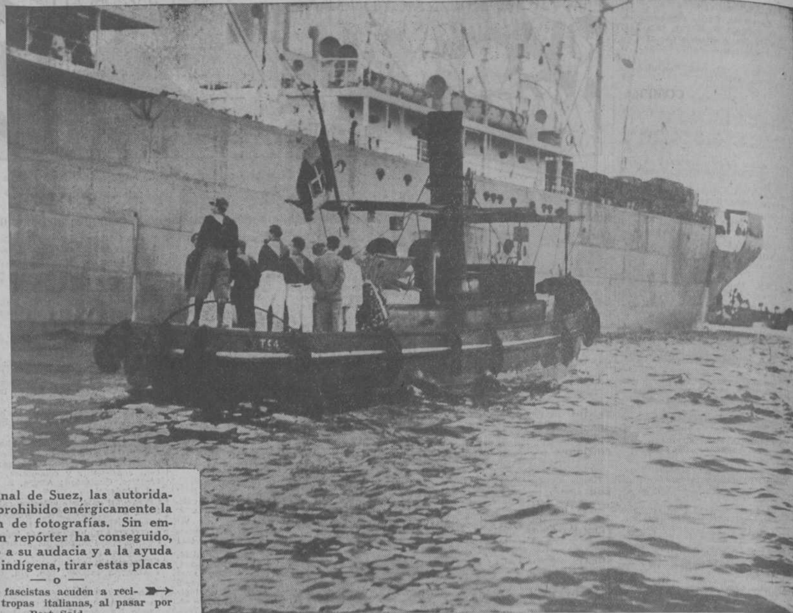
En el Canal de Suez, las autoridades han prohibido energicamente la obtención de fotografías. Sin embargo, un repórter ha conseguido, apelando a su audacia y a la ayuda de algún indígena, tirar estas placas