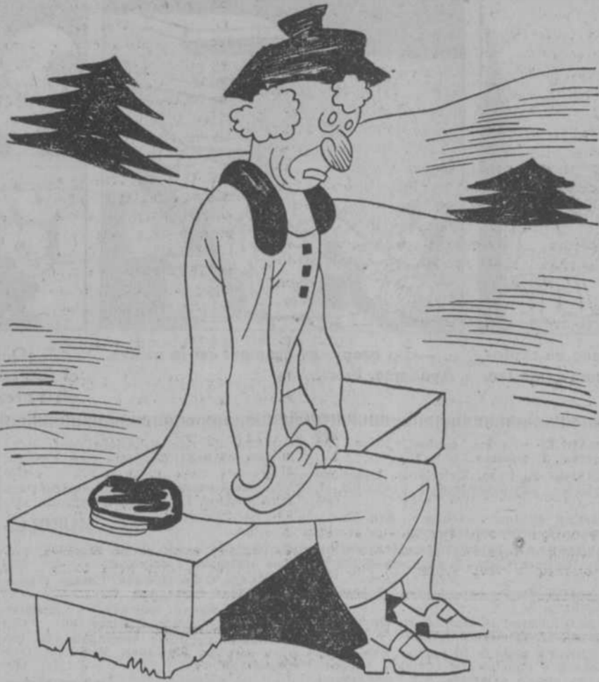
—Y ahora a esperar el sábado. ¡Si no hacemos semana inglesa!