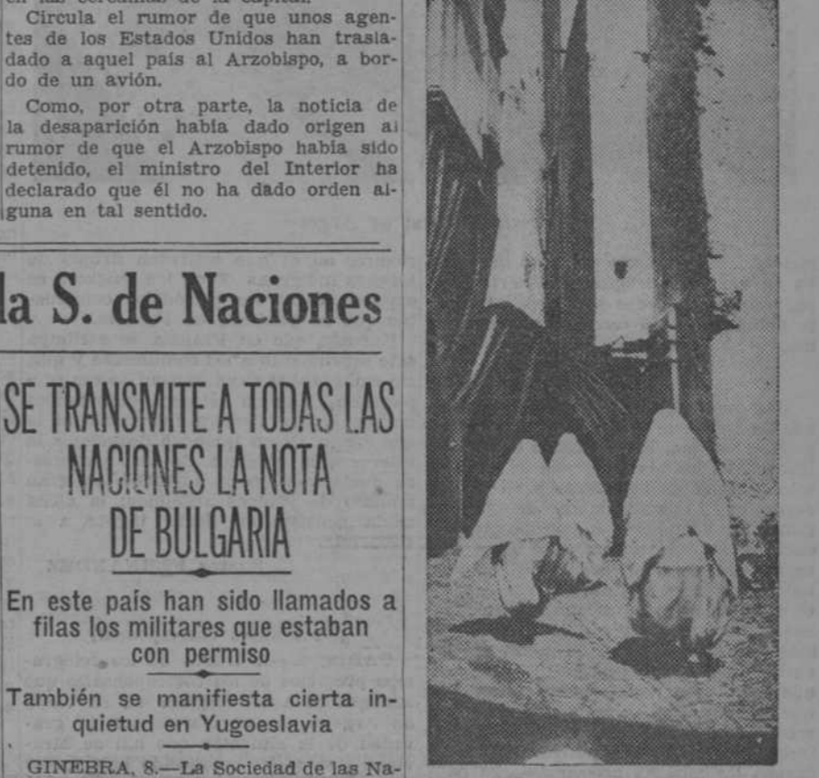
Una calle del viejo Argel. La calle del Mar Rojo

Interrogado por la tarde el jefe del Gobierno sobre la visita de la minoría parlamentaria socialista al Jefe del Estado, el señor Lerroux dijo que, en efecto, tenía noticia de esta visita, aunque no sabía el día que iba a realizarse, pues cuando le visitaron algunos diputados de esa minoría le consultaron si le parecía bien que hicieran esta gestión.