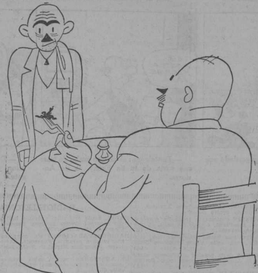
—He comido muchas veces calamares; pero tan negros como éstos, nunca. —No le extrañe; los pescaron cuando venían del entierro de la sardina.