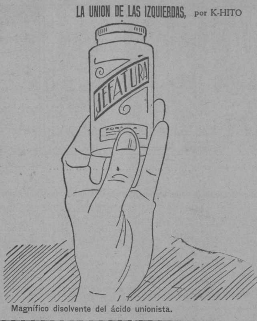
Magnifico disolvente del ácido unionista.