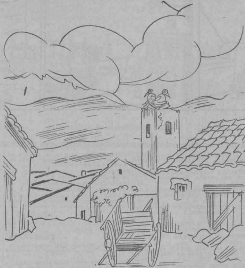
Las horas de mayor paz, son cuando están cerradas todas las "casas del pueblo".