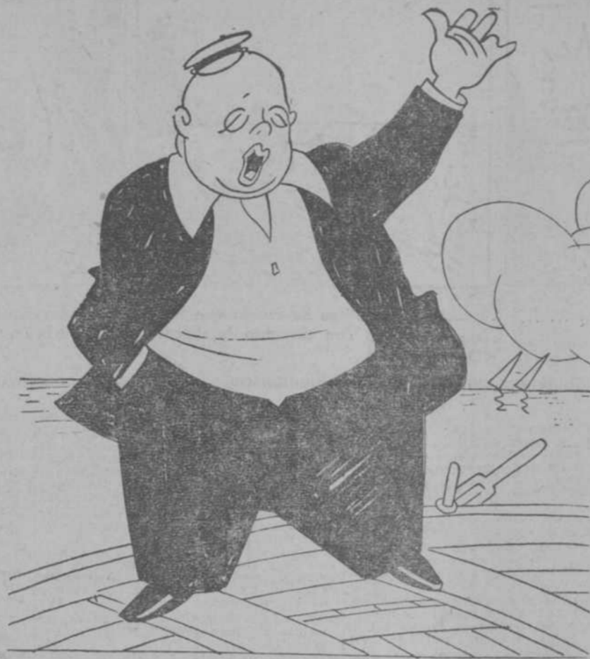
"Dichoso aquel que tiene—su casa a flote, y mil pesetas de dietas—para chupar del bote".