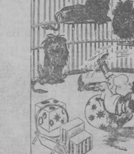
LA CAIDA DEL DOMADOR ("Passing Show", Londres.)