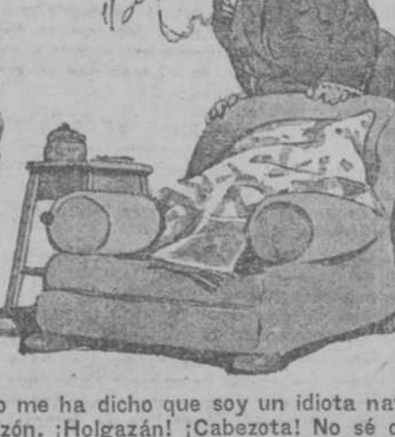
LA CAIDA DEL DOMADOR ("Weekly", Sheffield.)