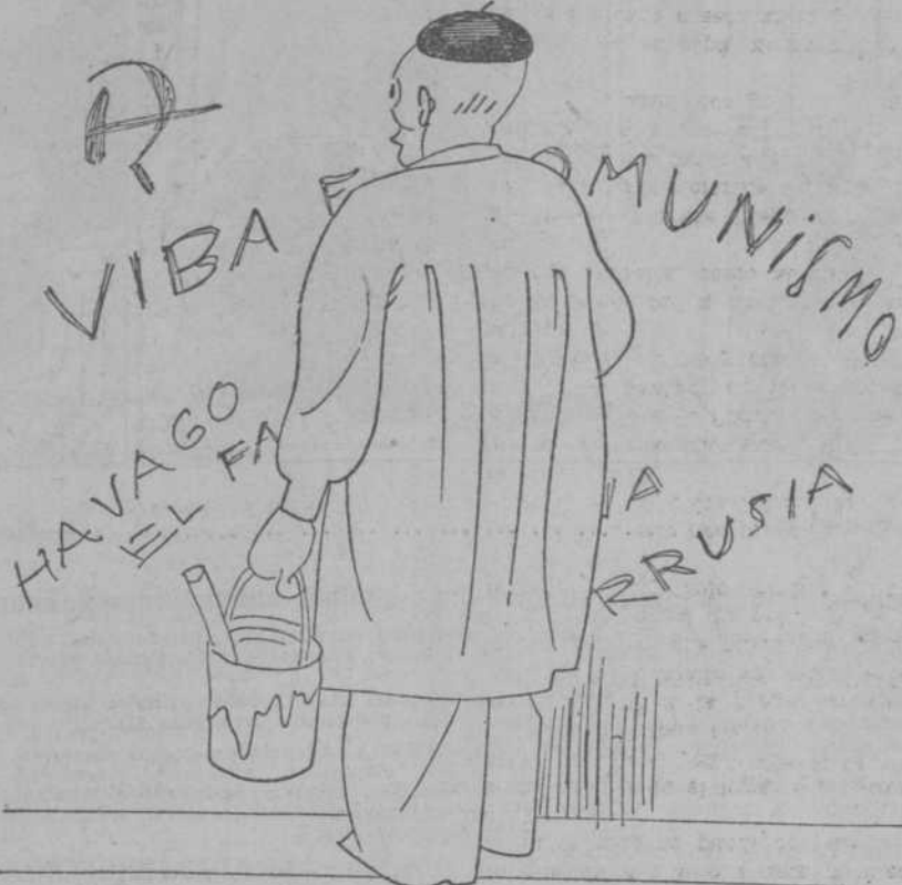
—Acabemos con esto. Ya los revolucionarios no pintan nada.