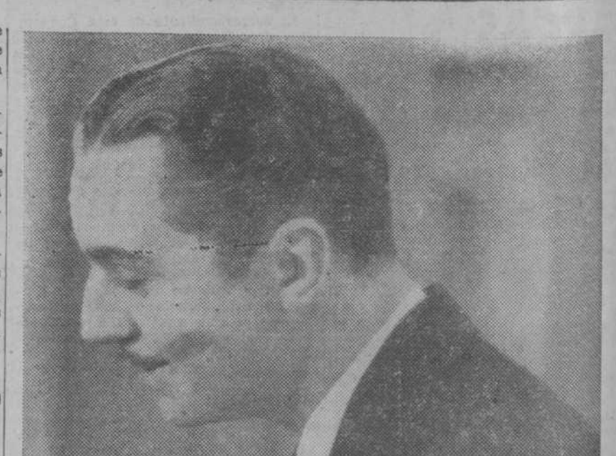
William Powell, primera figura de "El altar de la moda"