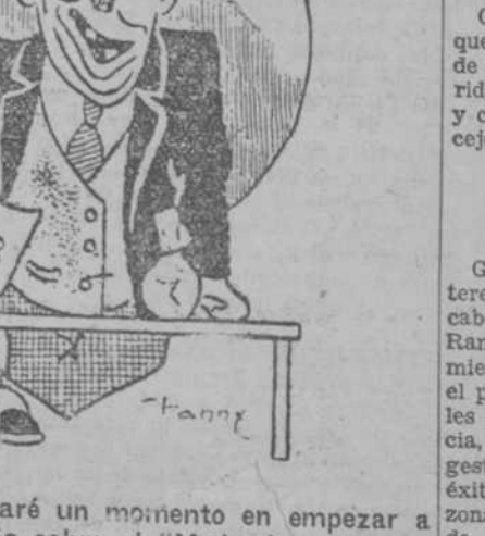
LA CAIDA DEL DOMADOR ("Moustique", Charleroi.)