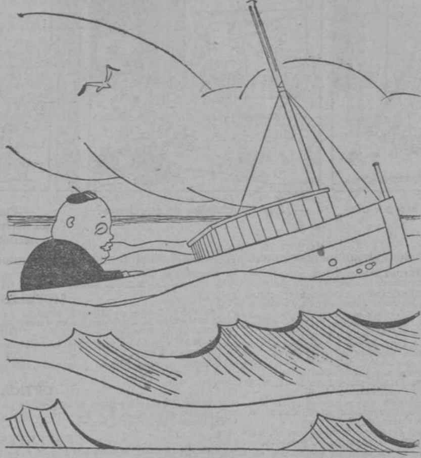
—Lo peor que me puede pasar es tropezar con una mina.