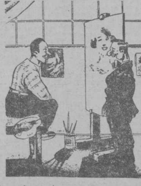
—Tengo dos cuadros magníficos. —De qué época son? —De la época en que yo tenía dinero. ("Sie und Er", Zofingen.)