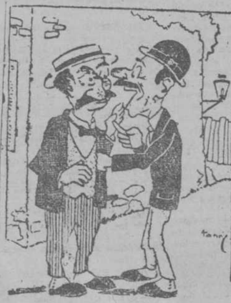
—Vente a comer a casa. —Imposible. Tengo que ir al "Barbero de Sevilla". —¿Y no puedes cortarte el pelo mañana? ("Moustique", Charleroi.)