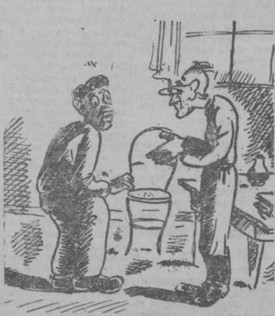
EN CASA DEL MEDICO —Espero, doctor, que no será nada. —Cinco duros, nada más. ("Gazzettino Illustrato", Venecia.)