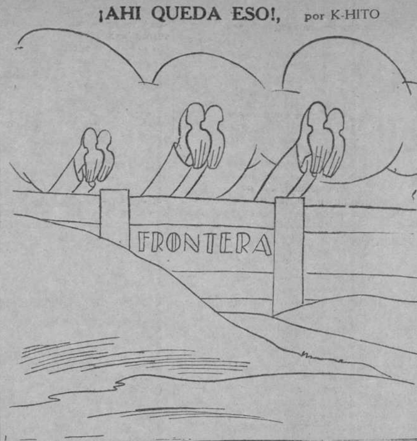
Lo que es el talento—lo que es la mollera; por lo visto, este chisme—lo salta cualquiera.