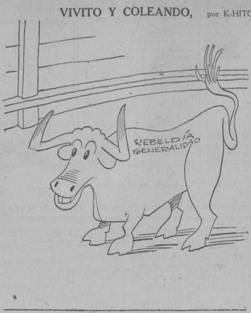
¡Al toro, antes de que surja un espontáneo!

bais en vuestra conciencia infantil "la primera vez" que acudisteis al santo tribunal de la Penitencia? Vosotras, bella mitad del género humano, ¿olvidaréis la emoción con que escuchasteis las "primeras" palabras de amor que llegaron a vuestros oídos? ¿Olvidará el militar el "primer" día que entró en fuego? ¿Olvidará alguien la alegría que le produjo el "primer" dinero que ganó? Pues bien; cuando el niño va a recibir su bautismo académico, cuando va a sufrir su "primer" examen oficial, ¿con qué se encuentra? Conque cualquier día, en el colegio a que asiste, se le hizo probar más y mejor su competencia que en el examen en el Instituto; en éste, en pocos minutos, se le da por impuesto en la enciclopedia de la primera enseñanza. ¿Unos minutos para un examen que necesita cerca de dos horas!