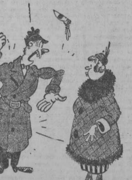
El esposo y su familia pasan un día de campo.