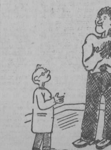
—Doctor, yo debo de tener asma. —¿Qué síntomas experimenta usted? —He subido ayer un piano a un quinto piso y llegué casi sin respiración. ("Gazzettino Illustrato", Venecia.)

ENCAUSTICO ALIRON y siempre parecerán nuevos.