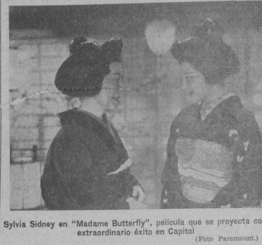
Sylvia Sidney en "Madame Butterfly", película que se proyecta con extraordinario éxito en Capitol

COINCIDIENDO el aniversario de la muerte del glorioso artista de la tauromaquia, "Joselito", la Dirección del Cine Actualidades presentará el próximo lunes, día 9, una de las películas que, sin duda alguna, habrá de llamar poderosamente la atención, tanto de los aficionados a la fiesta nacional como de los profanos, pues hábilmente, y recurriendo al maravilloso archivo que posee el inteligente cinematógrafo don Rafael Salvador, se ha podido conseguir hivar un documental retrospectivo de la vida de tan prestigiosa figura de la tauromaquia, tanto en sus tardes de triunfo como en los momentos en que podía dedicarse "Joselito" a su afición predilecta que era el toreo campero, y las reuniones al aire libre con sus mejores amigos y compañeros. En la película "La vida de Joselito" se recogen todas las vicisitudes por que tienen que pasar los que, atraídos por el brillo de los cañiles, luchan para ser algo, y así vemos dos muchachos que, sin más bagaje que un capotillo, se lanzan a los campos andaluces a torear, uno en plena noche mientras el otro vigila la posible aparición del mayoral. En otros momentos de tan interesante documental aparecen en escena de acozo, derribo y toreo en campo abierto las famo-