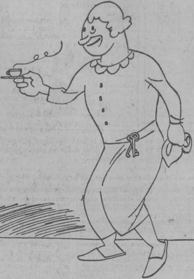
...y el gran chocolate de las patronas