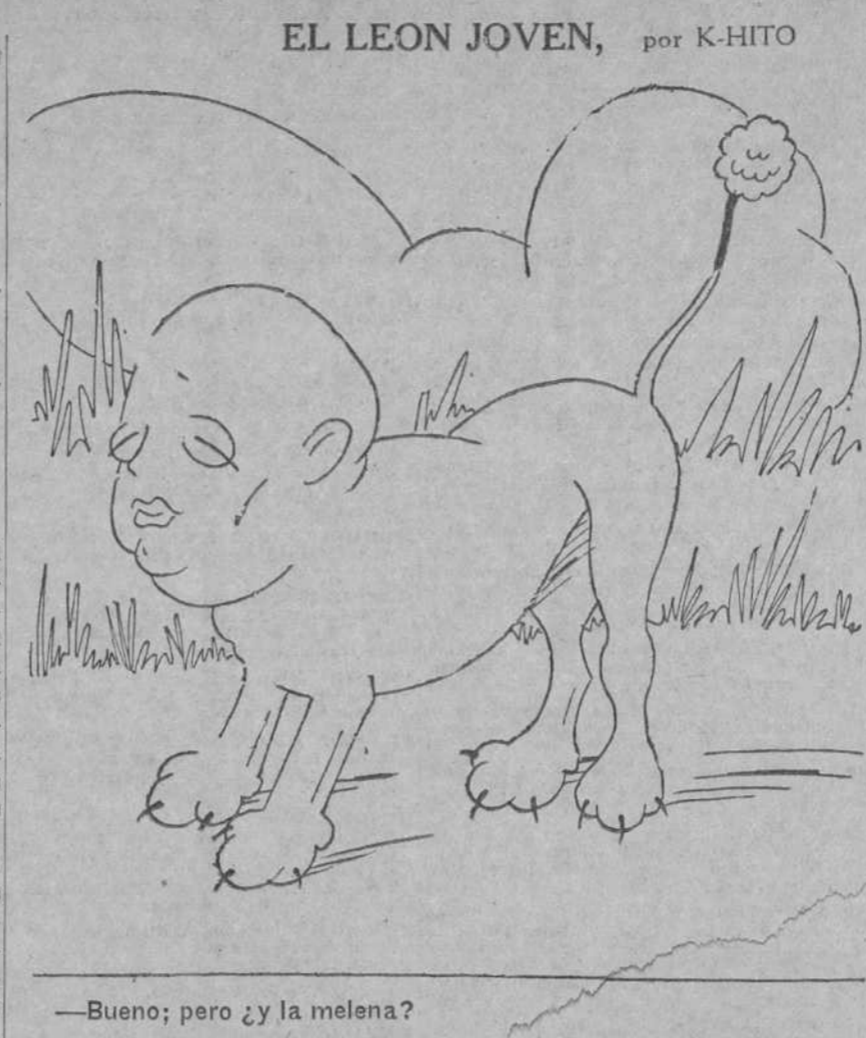
—Bueno; pero ¿y la melena?