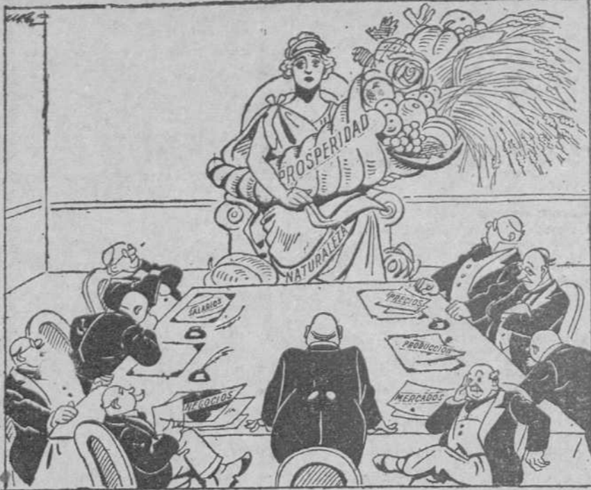
LOS FINANCIEROS INTERNACIONALES.—Juventud, después de muchas deliberaciones, hemos llegado a la conclusión unánime de que tú eres la causa de la depresión mundial.