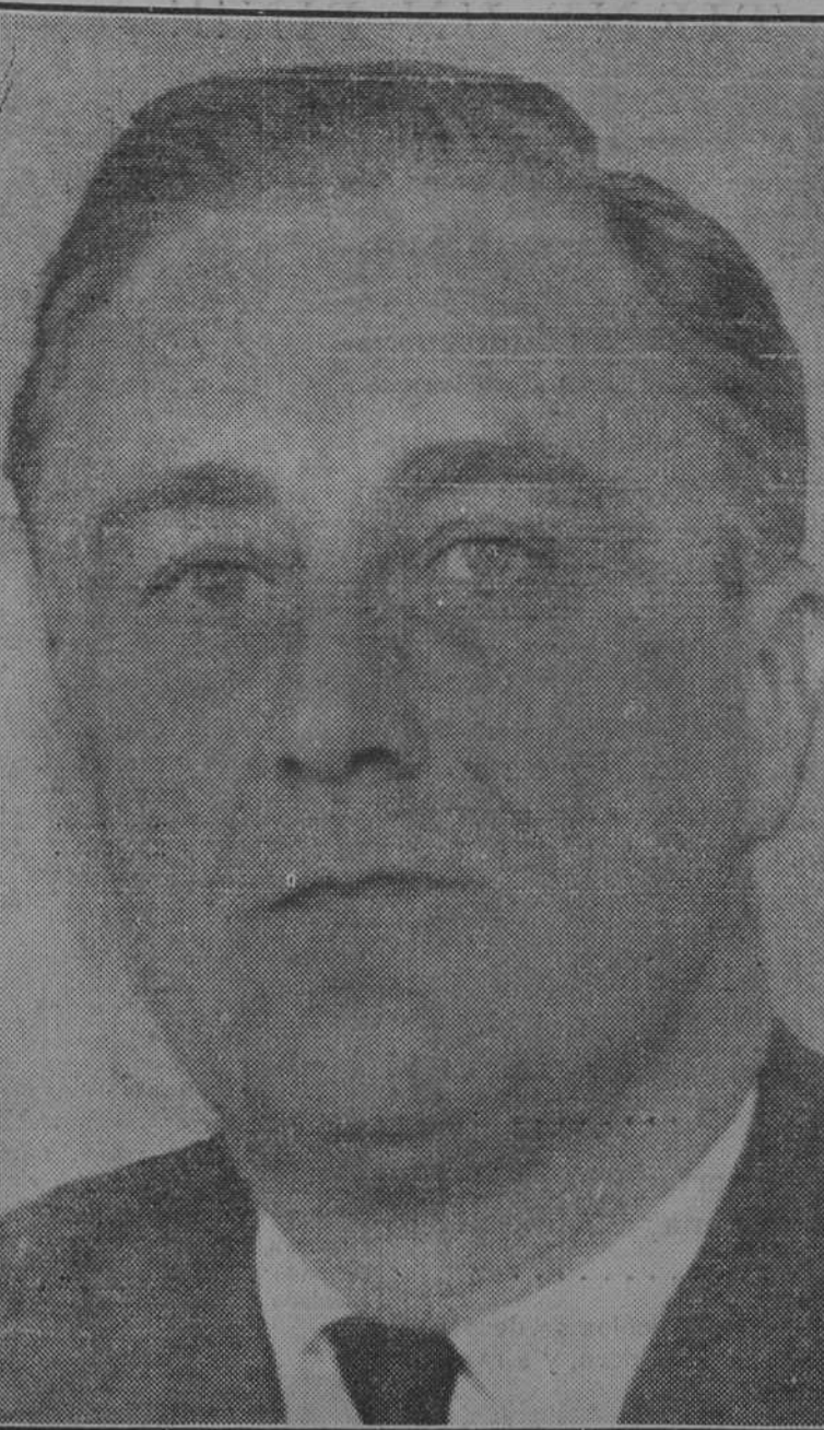
El Presidente de los Estados Unidos, Roosevelt, que ha sido nombrado doctor "honoris causa" de la Universidad Católica de Washington