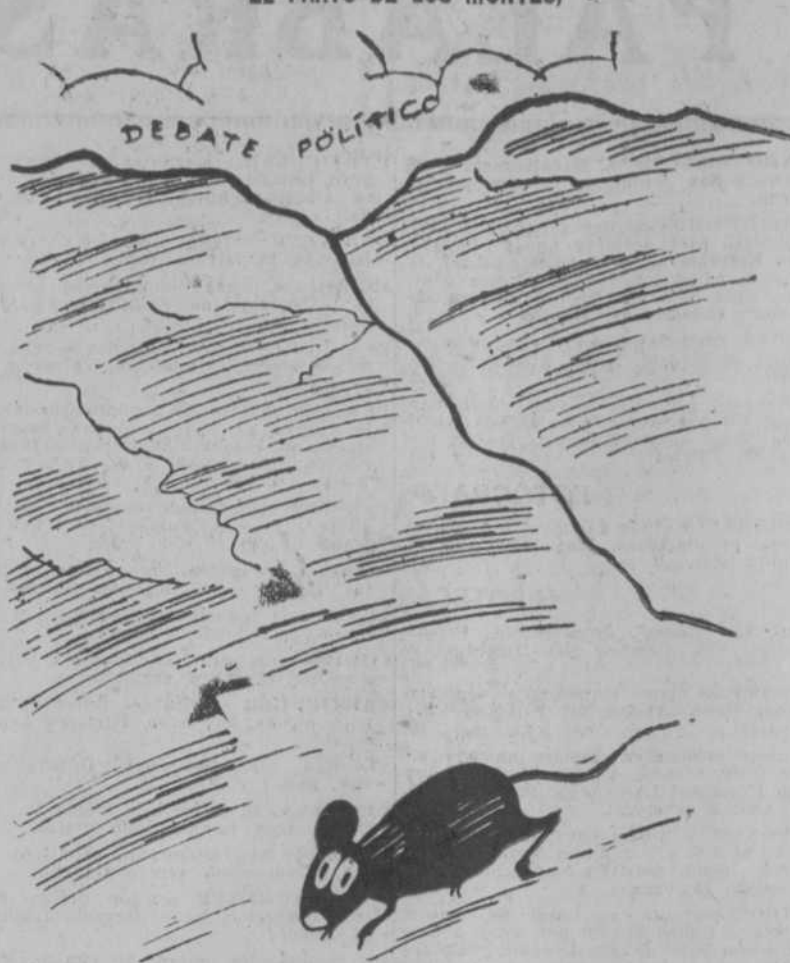
o el ratoncito Pérez Madrigal.