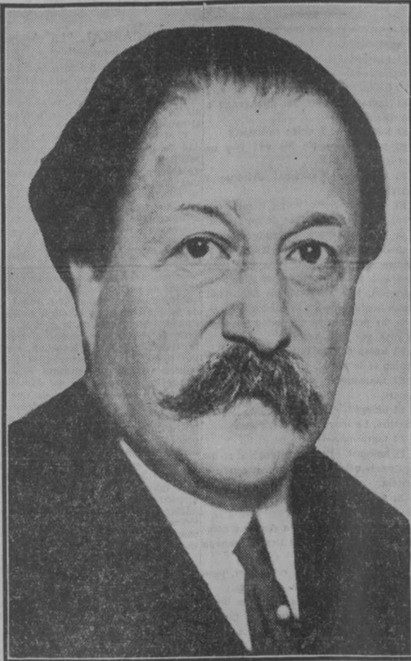
Pierre Monteux, director de orquesta francés, que va a actuar al frente de la Filarmónica de Berlín

El célebre director de la Sinfónica de París es el primer francés que ha sido llamado, después de la guerra, a dirigir la gran orquesta berlinesa. Ha sido invitado a dirigir la interpretación de obras francesas de Frank, Debussy y Dukas.