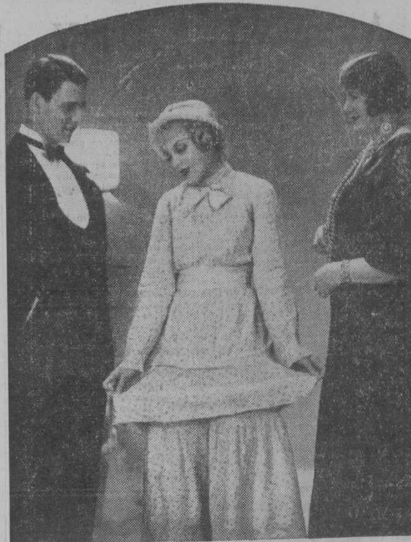
Una escena de la comedia "Hay que casarlos", que el lunes estrena el aristocrático Callao