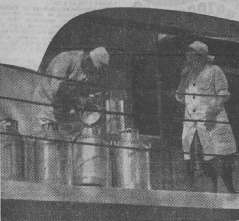
Una escena del "film" "La línea general", que se estrenará pronto