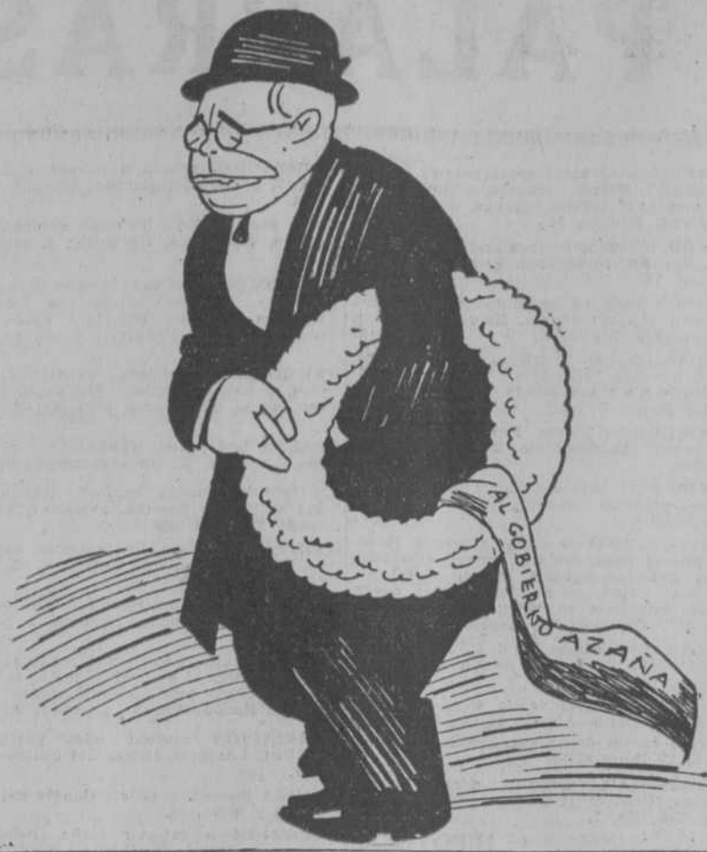
¿Con el estreno de la corona?