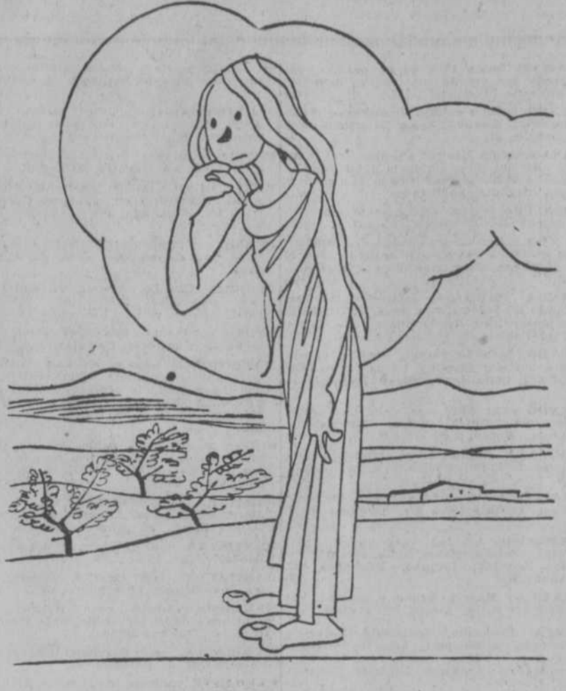
—Y ahora voy a coger la ramita de olivo... sin que me vea el cortijero.