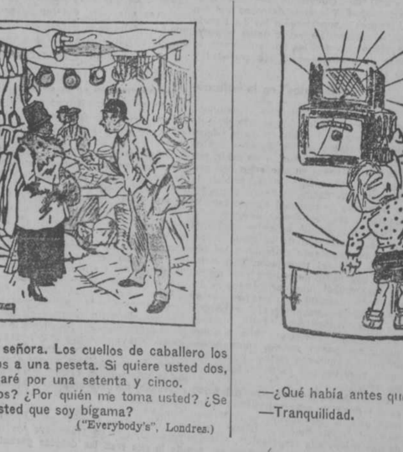
—Sí, señora. Los cuellos de caballo los vendemos a una peseta. Si quiere usted dos, se los daré por una setenta y cinco. —¿Dos? ¿Por quién me toma usted? ¿Se figura usted que soy bigama? ("Everybody's", Londres.)

Animo firme. Lo más admirable ha sido el espíritu que han conservado los evadidos. Ni un solo día de desánimo.