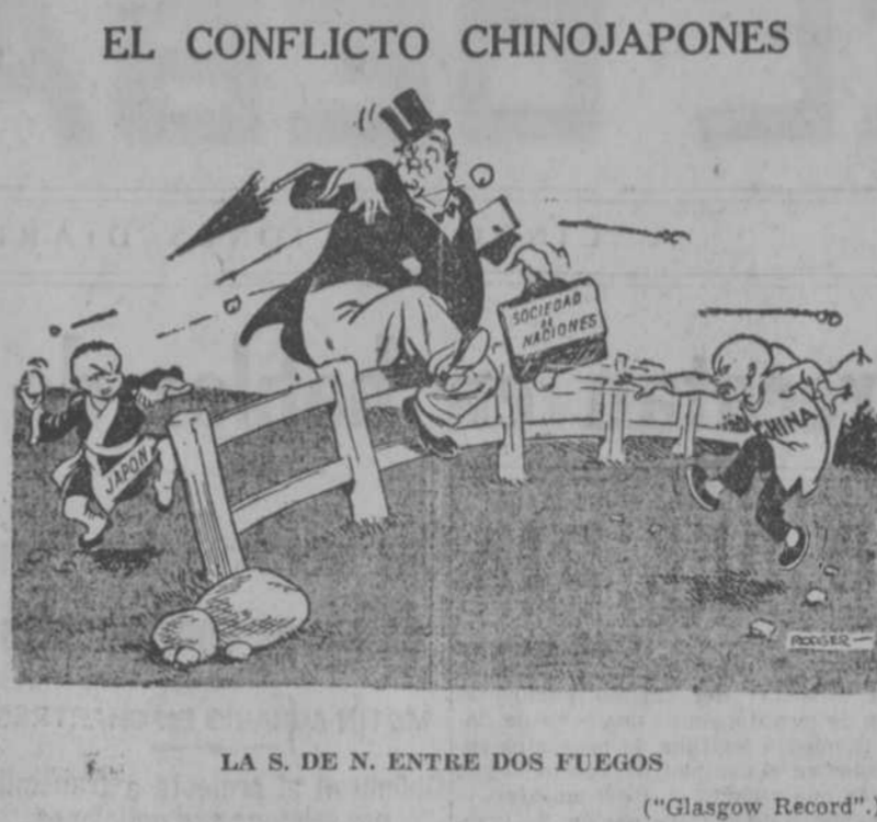
LA S. DE N. ENTRE DOS FUEGOS ("Glasgow Record")

Otra vez la vida. El jefe de la Policía internacional asió a recibirme. Luego vino la oleada de periodistas, de curiosos, de desconocidos, que acudían a felicitarme.