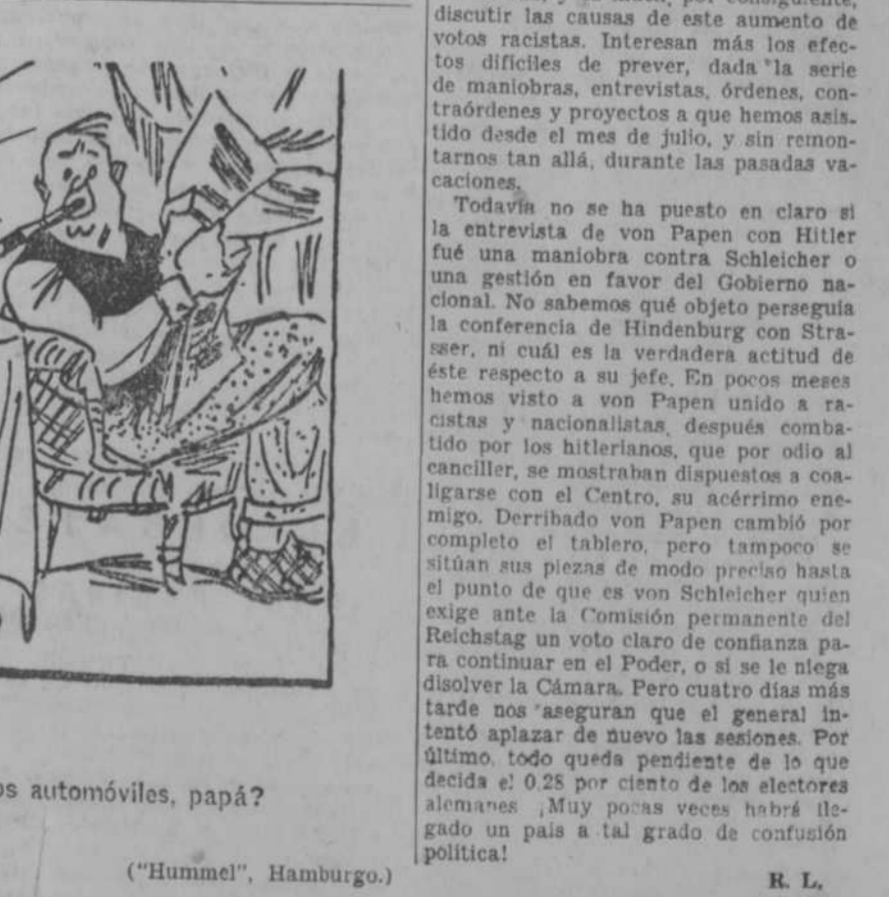
—¿Qué había antes que los automóviles, papá? —Tranquilidad. ("Hummel", Hamburgo.)