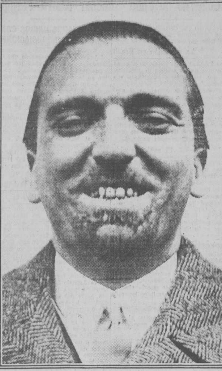
Grandi, ex ministro de Negocios Extranjeros de Italia, nombrado embajador en Londres