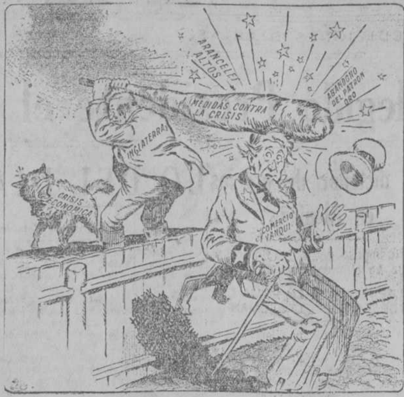
DE RECHAZO ("Chicago Post")

política con una serie de conferencias, hasta la una y media de la tarde, hora a la que se trasladaron a un hotel, donde don Niceto fue obsequiado con un banquete por muchos amigos venidos de Priego para acompañarle el día de la elección presidencial. La comida tuvo carácter íntimo, y en el hotel negaron que se hubiera celebrado.