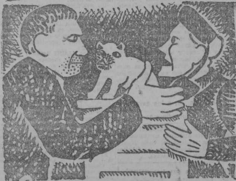
—¿Qué tal es ese específico contra la calvicie?