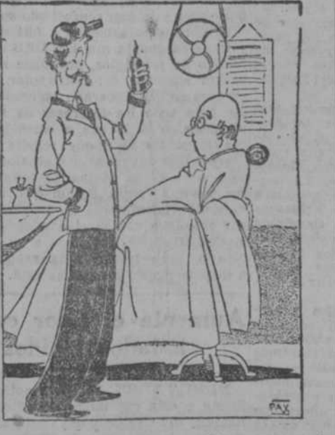
—¿Qué tal es ese específico contra la calvicie?