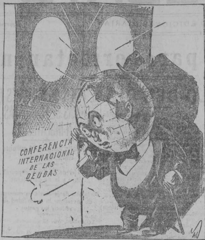
EL MUNDO ESPERA