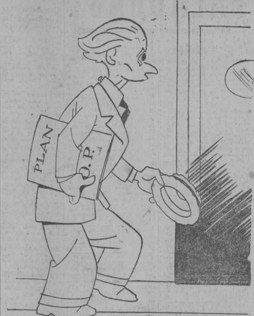
—No sé qué es; me acaban de entregar este plan. Conque a mí, ¡plim!