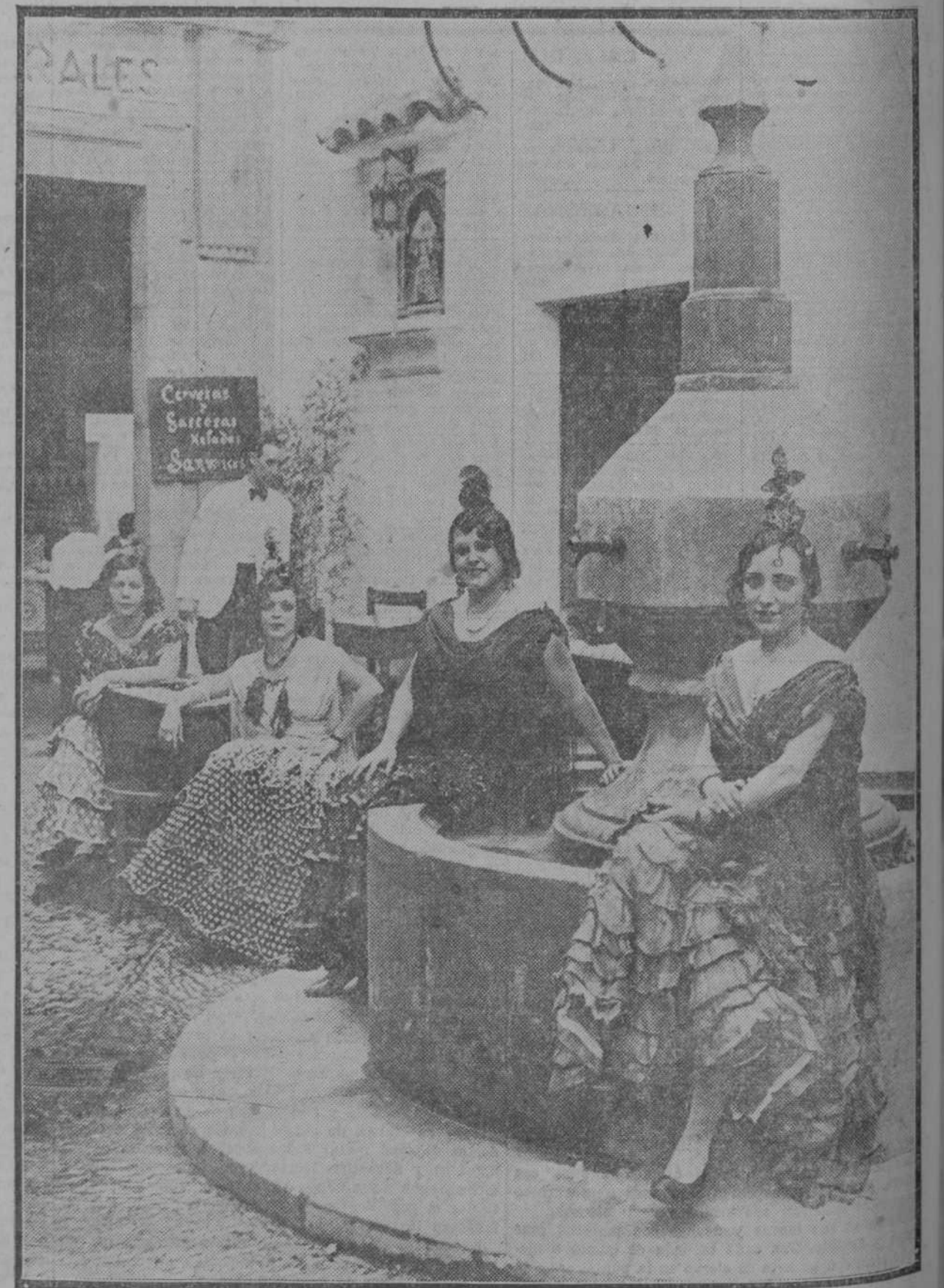
BARCELONA. Inauguración de la Semana Andaluza en los jardines del Pueblo Español. Un detalle de la fiesta.