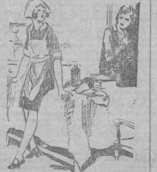
LA SEÑORA.—¿Deja usted limpio todo el alumbrado y el cobre?