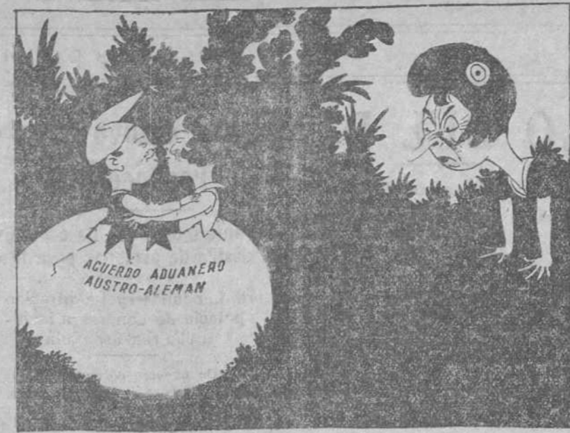
UN HUEVO DE PASCUA CON SORPRESA DESAGRADABLE