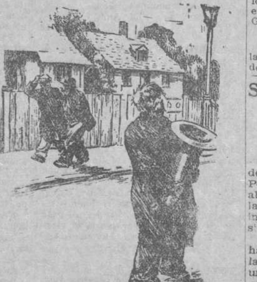
—Pero ¿qué hace? ¿No le han dado nada y a tocar?