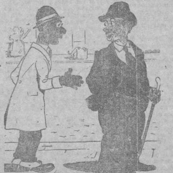
—¿Pero no me conoce usted? No es usted buen filonista, señor García.

ALBANY (Australia), 18.—Comunicación de Laverton que un incendio ha reducido a cenizas una granja, perteneciente al mismo propietario, y pesonas y numerosas cabezas de ganado. Los daños son muy importantes.