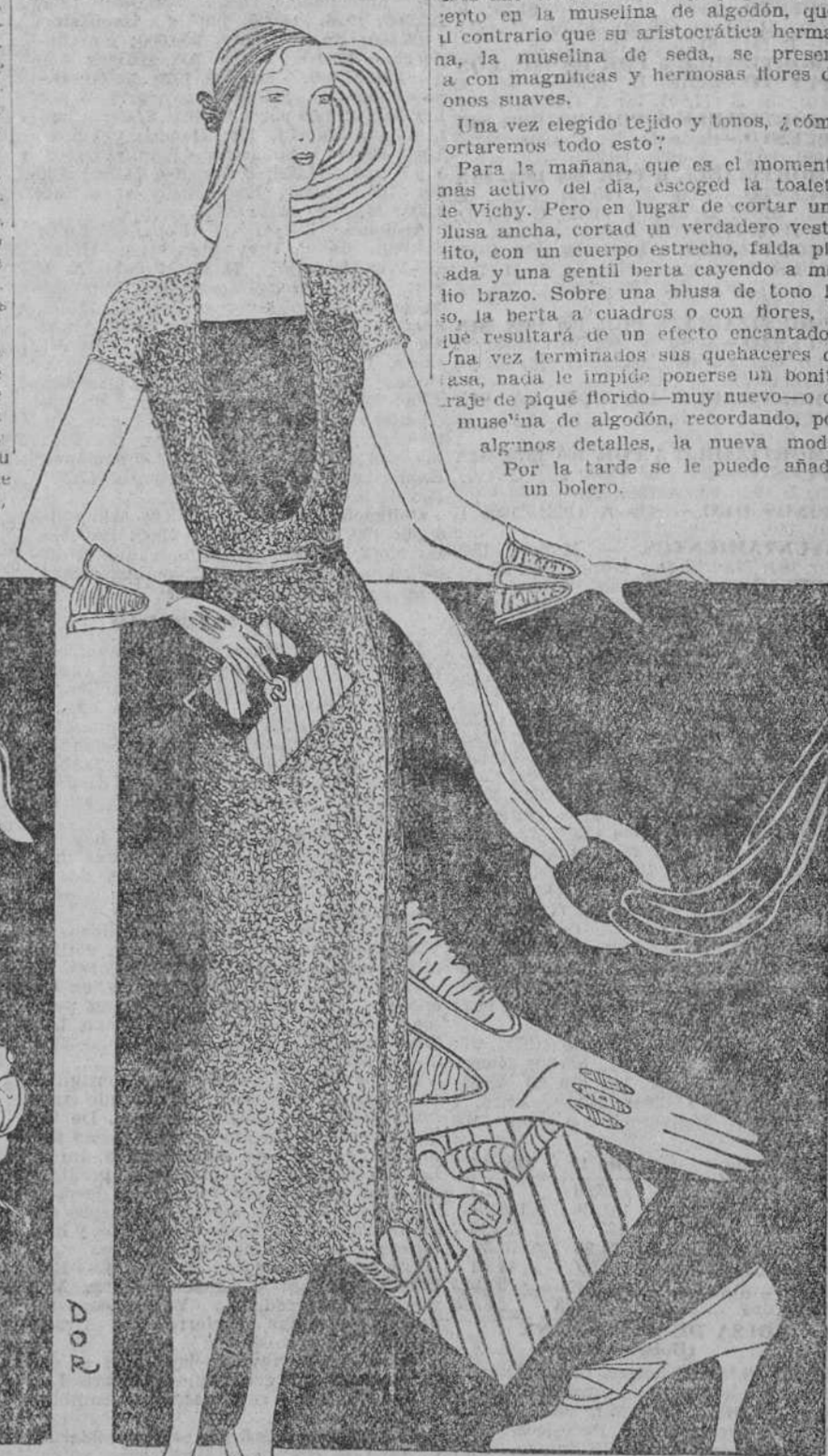
Una muchachita de plisados; sandalias de crespon. Vestido de grueso escote blanco crema sobre fondo negro; quantes de suecia murustados de abullonados grises; bolsillo de crespon crema rayado y adornado de ibano; cinturón blanco y negro; zapatos de cabritilla gris; sombrero panamá.

Por la tarde se le puede añadir un bolero.