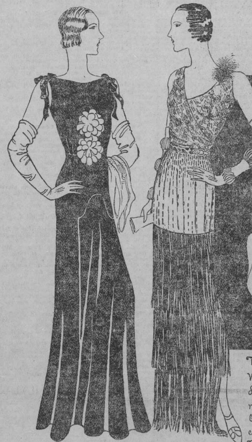
Tres modelos Worth y detalles. De izquierda a derecha: Vestido de raso negro; flores de trozos de madera cubiertos de cellophane muy brillante; se complementa con un bolero bordado con perlas blancas y va bordado de tubos brillantes. Traje de noche mamón chocolate; flecos de seda en el mismo tono, bordado de perlas marrones; cinturón de leopardo; motivo de strass y aigrettes marrón; quantes de piel de zorra.