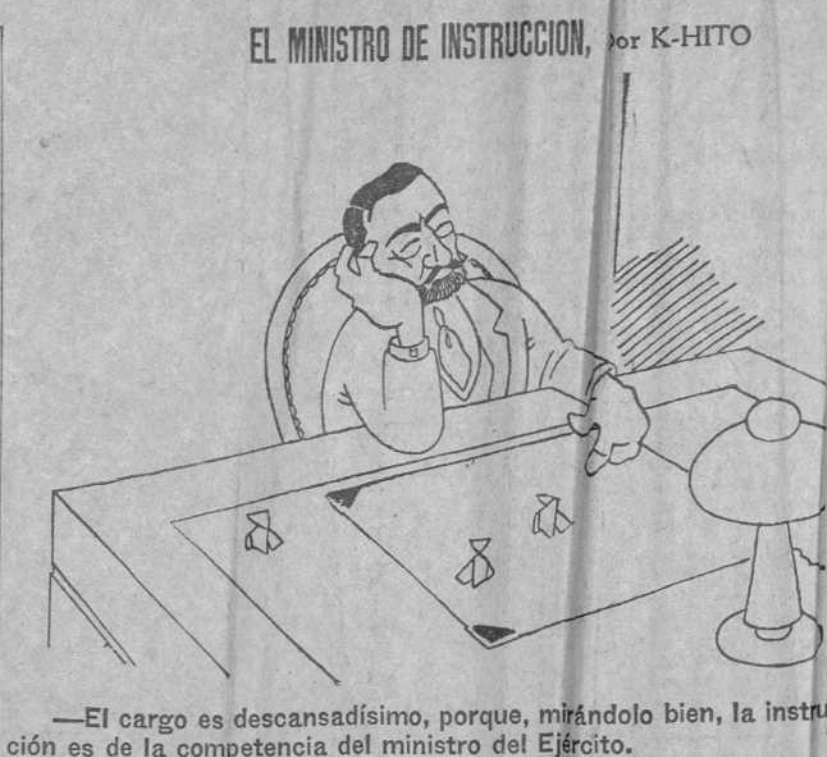
—El cargo es descansadísimo, porque, mirándolo bien, la instrucción es de la competencia del ministro del Ejército.