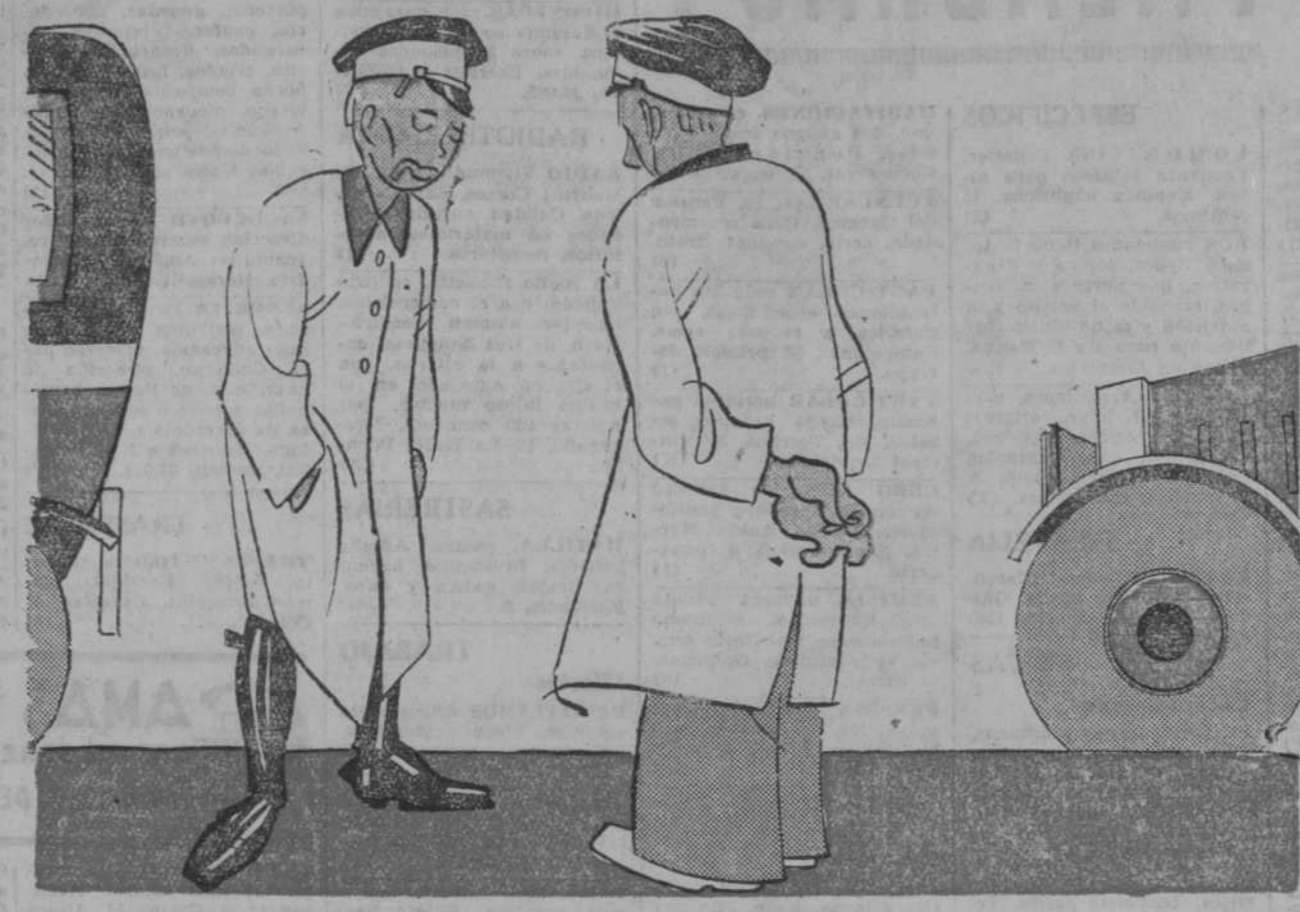
—Ya es un hecho: tarifa de sesenta y propina de setenta por kilómetro.