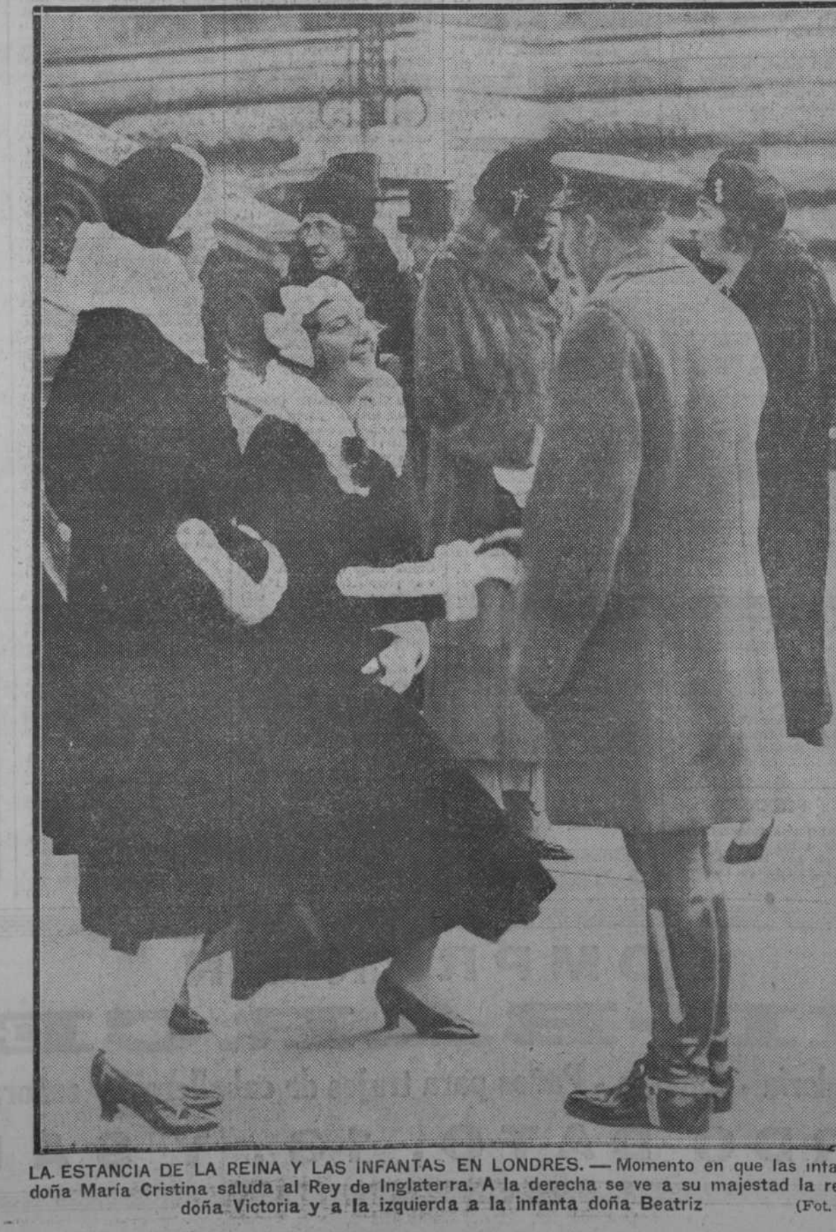
LA ESTANCIA DE LA REINA Y LAS INFANTAS EN LONDRES. — Momento en que las infantas doña María Cristina saluda al Rey de Inglaterra. A la derecha se ve a su majestad la reina doña Victoria y a la izquierda a la infanta doña Beatriz