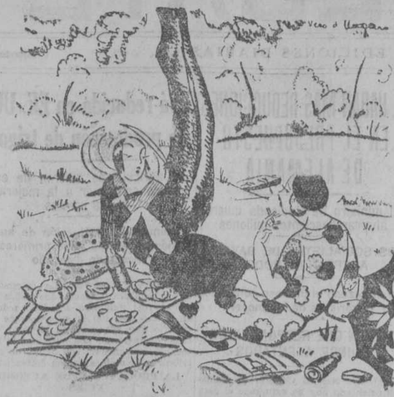
—Pero cómo votó tu marido por la ley seca? —Es que estaba completamente borracho. (“Il Travaso”, Roma.)