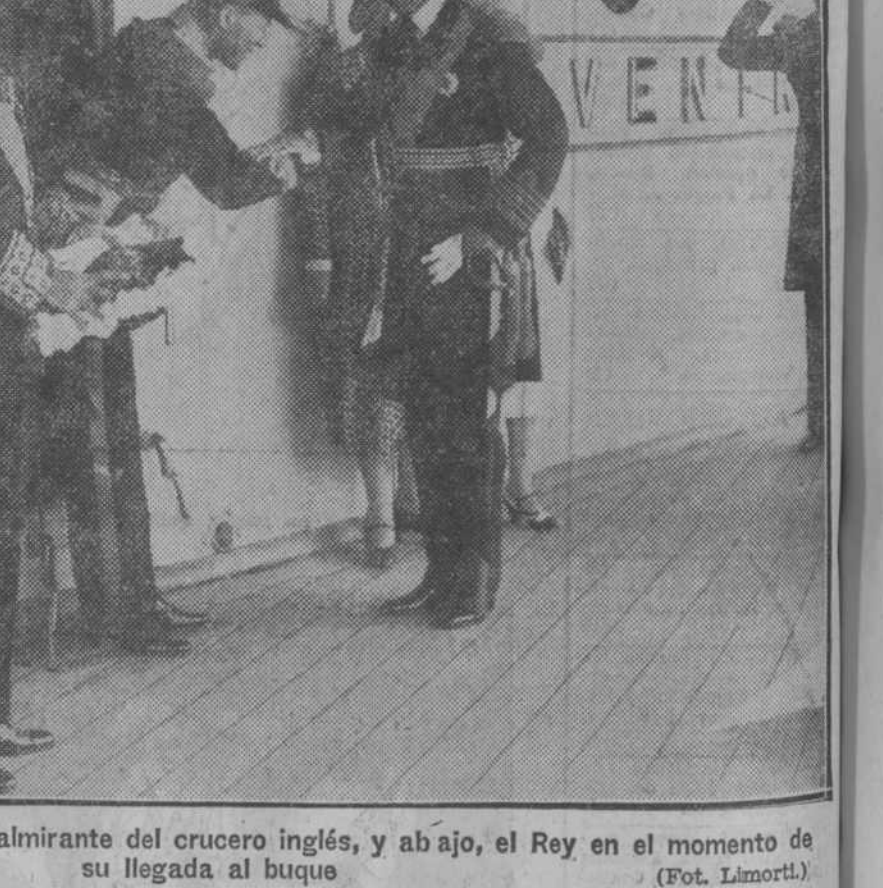
Arriba, sus majestades con el almirante del crucero inglés, y abajo, el Rey en el momento de su llegada al buque