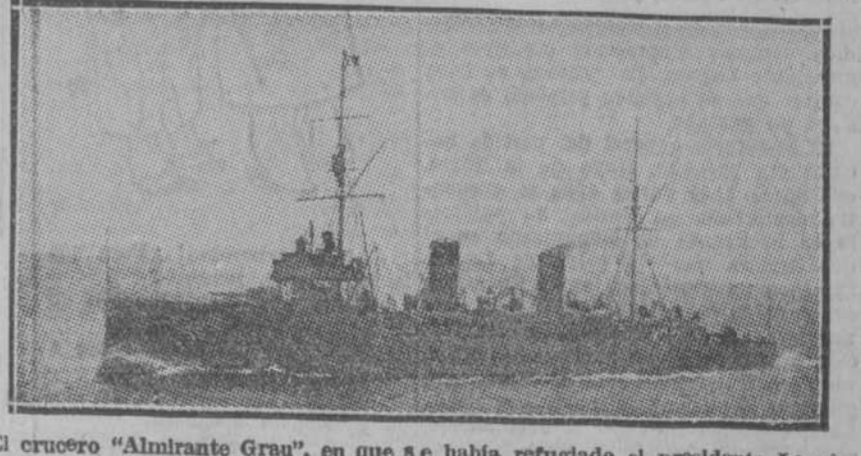
El crucero "Almirante Grau", en que se había refugiado el presidente Leguía

SANTIAGO DE CHILE, 26.—Se desmiente la información de que el independiente coronel Sánchez Cerro, se haya puesto en viaje con dirección a Lima. Dicho señor sigue en Arequipa, habiéndose negado a trasladarse a la capital del Perú por entender que la Junta militar que se ha hecho cargo del Poder al dimitir el presidente de la república es hechura del propio señor Leguía. Associated Press.