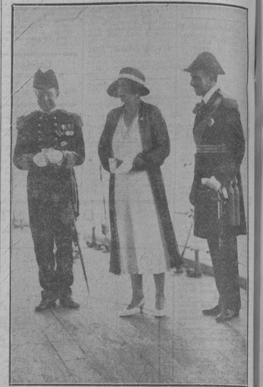
Arriba, sus majestades con el almirante del crucero inglés, y abajo, el Rey en el momento de su llegada al buque