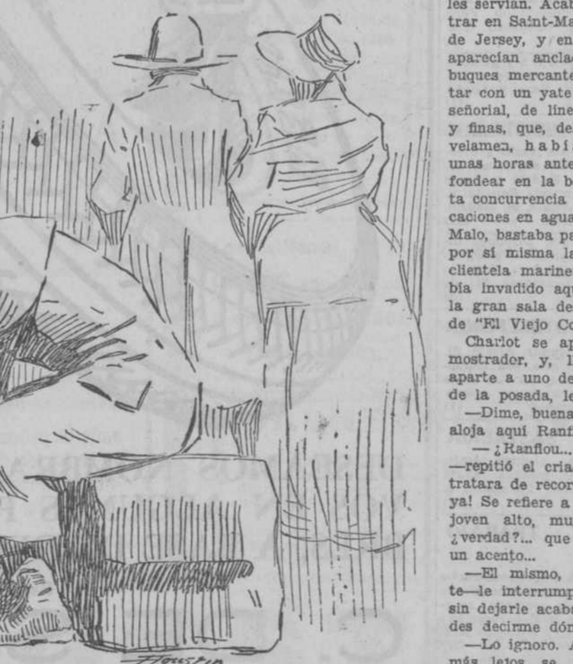
prorrumpió en desesperados sollozos.

Folleto de EL DEBATE 79) R. M. GOURAUD D'ABLANCOURT LAS ESPINAS TIENEN ROSAS NOVELA (Versión española de EMILIO CARRASCOSA expresamente hecha para EL DEBATE) (Ilustraciones de Agustín)