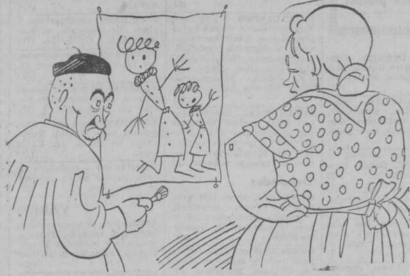
Ten "cudiao", Fede, que eso se da un aire a "Las Meninas". Te lo compran "obcecos" y luego vienen los lios.