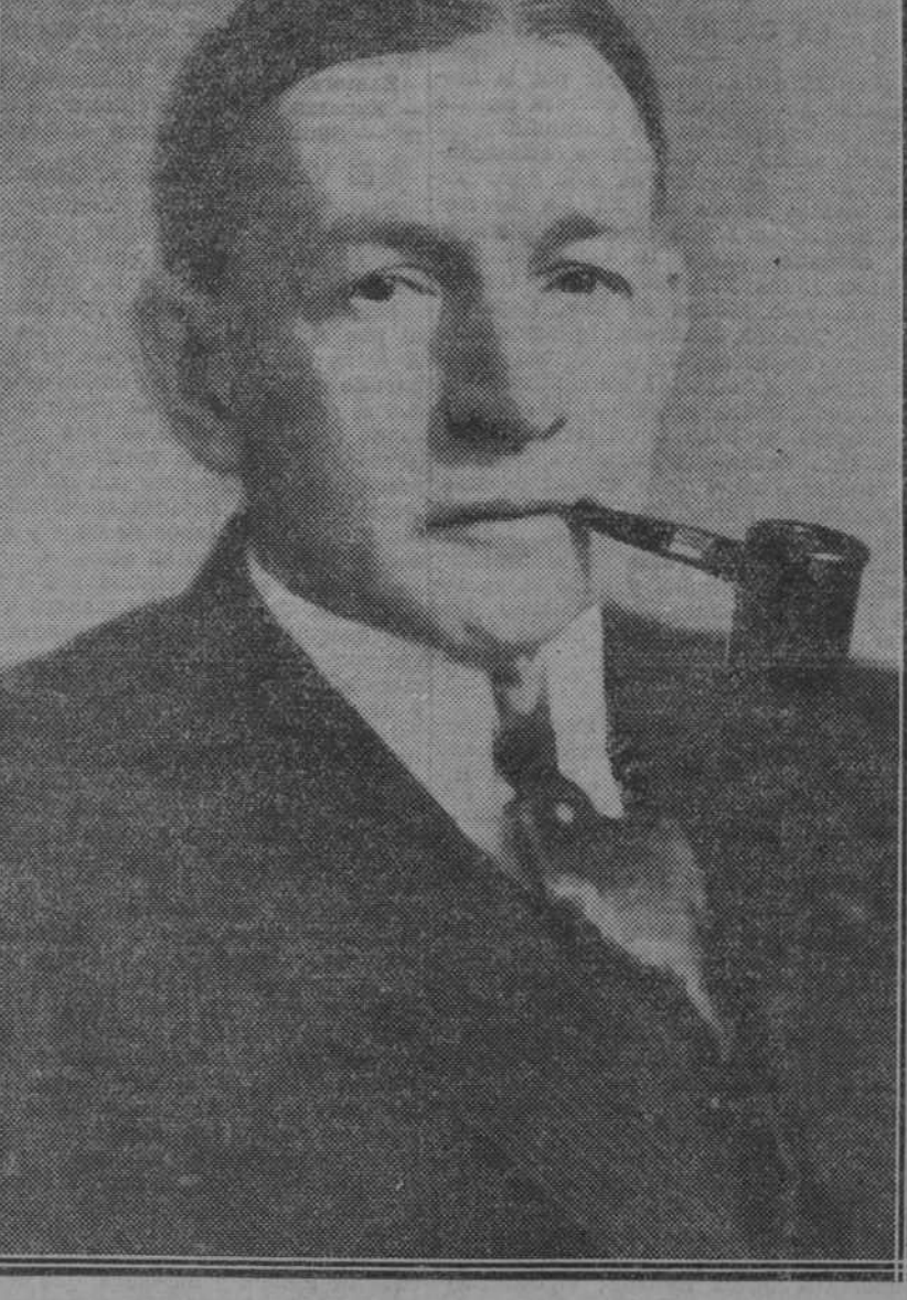
El general Dawes, a quien los ciudadanos de Chicago querían ofrecer la dictadura en la ciudad para acabar con las bandas de criminales

ROMA, 16.—El presidente del Consejo de ministros de Baviera ha enviado al Pontífice un telegrama asociándose a la alegría general de su propia nación por la beatificación de Conrado de Parzhám, celebrado ayer en el Vaticano, con el ceremonial de costumbre.