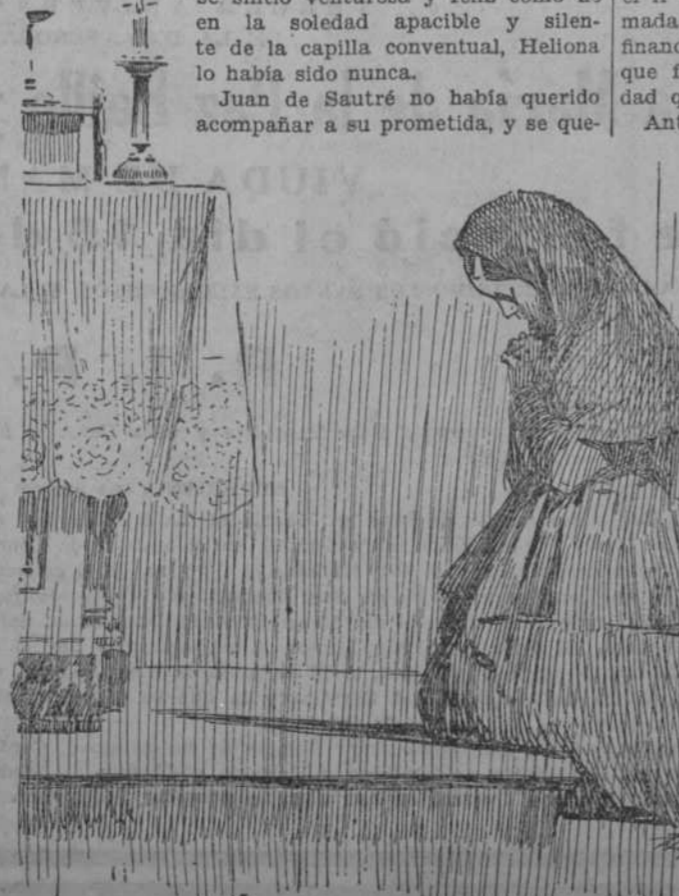
La joven se postó de hinojos a los pies de la imagen