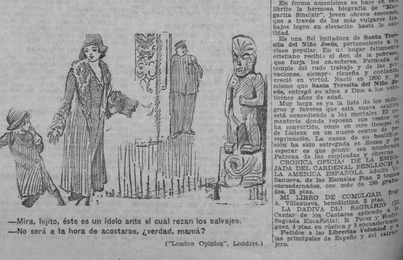
—Mira, hijito, éste es un idolo ante el cual rezan los salvajes. —No será a la hora de acostarse, ¿verdad, mamá? ("London Opinion", Londres.)

ESTIMACIONES LITERARIAS DEL SIGLO XVII. M. Herrero García. Un volumen en 8.º, de 424 páginas, 20 pts. Se intenta en este trabajo examinar el juicio que los grandes ingenios del mundo nos han legado sobre la nación que merecieron a sus contemporáneos, las contradicciones de que tal vez fueron objeto; en suma, conocer la ideología del siglo XVII en materias literarias.