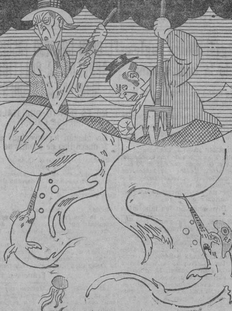
LAS RAZONES ANGLONAYANQUIS

El ministro de Justicia, al recibir ayer mañana a los periodistas, les obsequió con motivo de haber celebrado ayer su fiesta onomástica. Luego les comunicó que seguía trabajando en la extensa combinación de personal para la Magis-