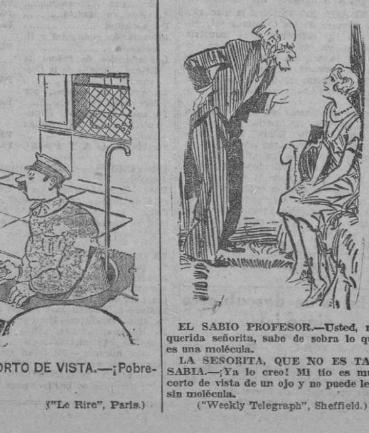
EL SABIO PROFESOR.—Usted, mi querida sobrieta, sabe de sobra lo que es una molécula. LA SESORITA, QUE NO ES TAN SABIA.—¡Ya lo creo! Mi tío es muy corto de vista de un ojo y no puede leer sin molécula. ("Weekly Telegraph", Sheffield.)