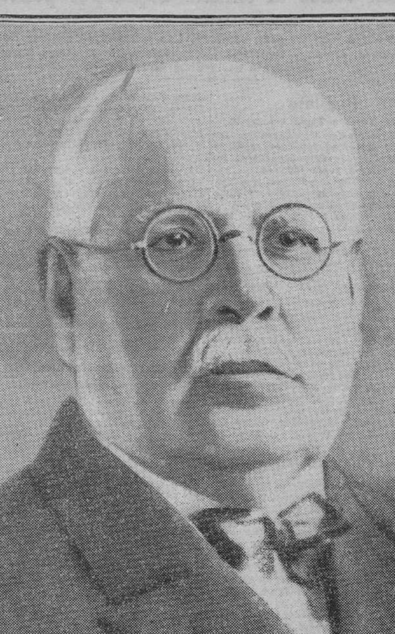
Don José María Echenique Gandarillas, que ha pronunciado una conferencia en la Unión Iberoamericana

El señor Echenique ha consagrado su actividad a la diplomacia y al periodismo, y en ambos sectores culturales ha llegado a ser en su país una personalidad relevante y destacada. Como diplomático, ha sido ministro plenipotenciario de su país en la República del Perú, donde estudió el famoso conflicto de Tacna y Arica. También ha sido embajador extraordinario en Bolivia, y por su competencia en los asuntos internacionales, fué más tarde designado miembro del Tribunal permanente de Arbitraje de La Haya. En cuanto al periodismo, es un buen escritor y dirige en la actualidad el "Diario Ilustrado", de Santiago de Chile. Es un ferviente amante de España.