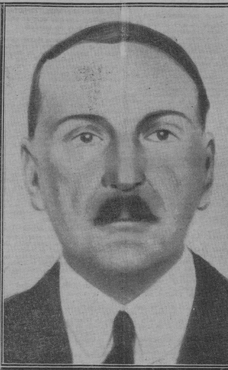
Don Enrique Rodríguez Larreta, escritor argentino que se halla actualmente en Madrid

Entre los escritores de la República Argentina pocos han logrado fuera de su patria el renombre de Rodríguez Larreta. Una novela suya, "La gloria de don Ramiro", ha dado la vuelta al mundo. No es ésta la ocasión de discutir si aquella es efectivamente "una vida en tiempos de Felipe II". Lo indudable es que sus calidades literarias merecen de cierto admiración. Otra novela de Larreta, "Zogobit", es también muy conocida y ha tenido en su última edición calurosa acogida en España. Larreta viene a nuestro país de embajador extraordinario. Preside la Delegación de su país para la Exposición de Sevilla.