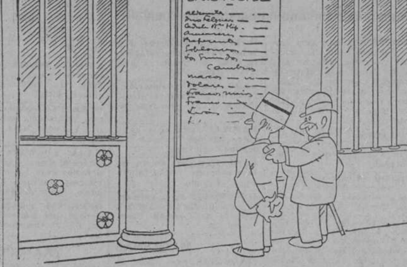
—¡Bien, maestro! ¿De modo que ya interesado por las acciones, las obligaciones y los cambios? —Si; es que quiero cambiar un par de las cortas esta tarde.

Cuarteto, Vergara (Gulpizcoa).—Dos o tres años, por lo menos, según dijo