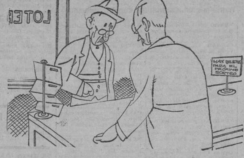
-Déme usted un "trigémio" para el próximo sorteo.