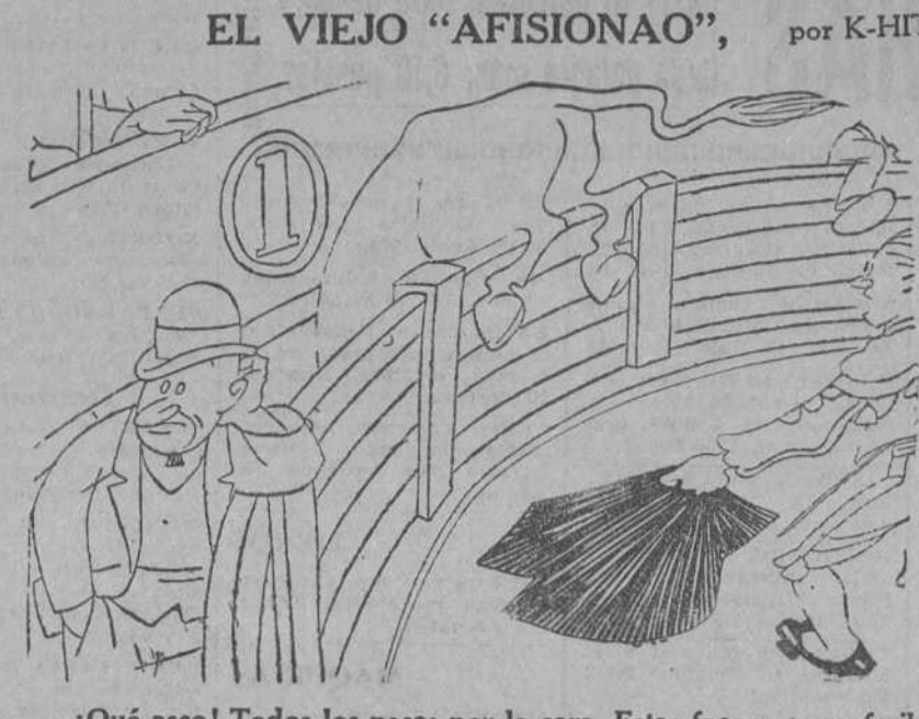
—¡Qué asco! Todos los países por la cara. Estas faenas es preferible no miraras.

Se afirma que Su Santidad les invitará para dar un nuevo concierto en el Vaticano, al cual asistirá el Papa personalmente.—Daffina.